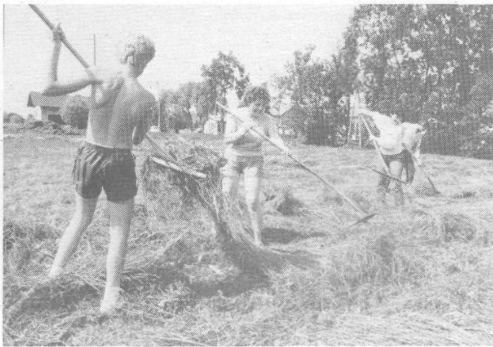
Poletje je tu in takšni posnetki niso več redkost