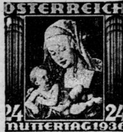
OSTERREICH MUTERTAG 1936

Vse države streme čedalje bolj po tem, da bi izdajale čim lepše znamke. Počasni smo še mi začeli capjati v to smer. Zlasti pri raznih spominskih in dobrodelnih znamkah je potrebno, da je slika na njih čim lepša, ker daje lepa slika jamstvo, da bodo zbiralci znamke radi kupovali. Motivi na znamkah so različni. Tu vidimo slavne moke, prizore iz zgodovine, tehnične novosti in še marsikaj drugega.