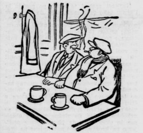
ZENTILMENA V KAVARNI

In kaj bo ostalo od vsega tega? V listih bomo brali samo jadikovanja nad mladino, ki je tako zgodaj padla v greh in zločin.