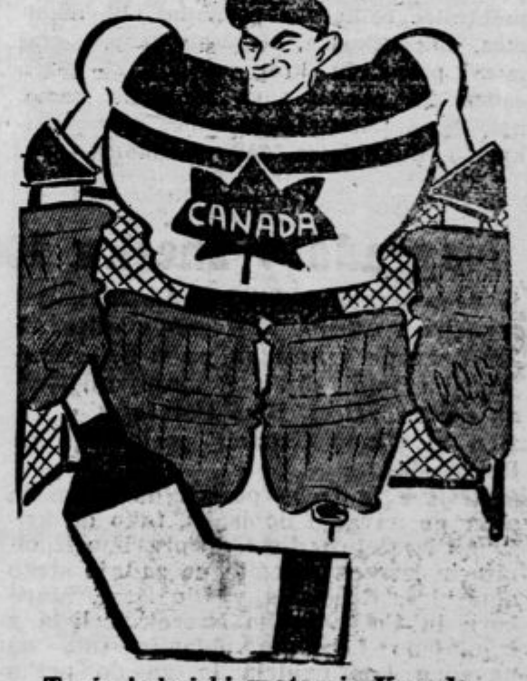
To je hokejski vratar iz Kanade, enako strašen in neprebojen, kakršnega so imeli tudi Čehi in Švicarji, pri katerih so se v petek in soboto naši učili te težke igre na ledu