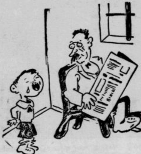
MATI IN SIN

nanesti na kožo, ki jo pa moramo poprej dobro umiti z milnico vodo, da se znojnice ne zamašijo, in da more koža dihati. Tista, ki uporablja kremo, si mora obraz pred pudranjem dobro obrisati. Puder kolikor ga je na koži preveč, je treba odstraniti. Najbolj primeren v ta namen je čopič ki je podoben čopiču za britje. Za vsako barvo polti je treba seveda izbrati primerno barvo pudra.