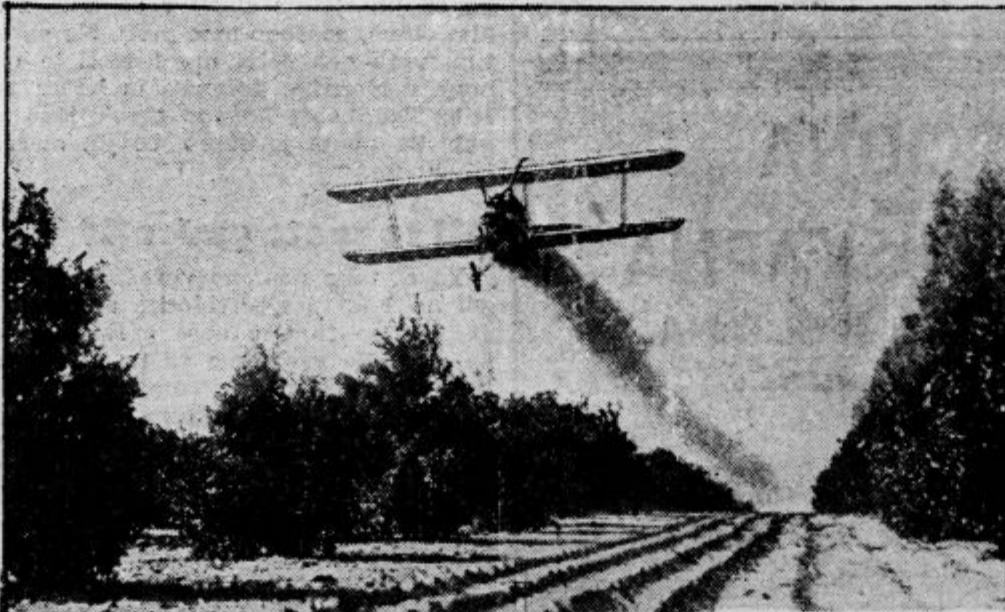
To ni bombarder — pline siplje proti mrčesu

To letalo je najnovejši dokaz o napredku letalske tehnike in dalekosežnih možnostih, s katerimi danes računajo ameriški vojni strokovnjaki. Po proračunih in načrtih naj bi to letalo doseglo maksimalni