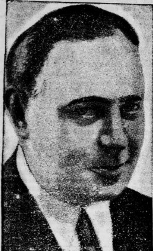
mogel pridobiti za film slabše kvalitete. Je nedavno podal zanimivo izjavo o bo-

Med stebri nemškega filma, ki je sicer v zatonu, je nedvomno Emil Jannings. Ta mož, ki je bil vedno velik umetnik in ga tudi noben režiser ni