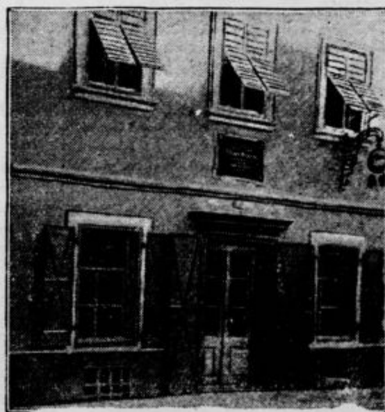
Hiša Prešernove smrti v Kranju s spominsko ploščo nad vhodom