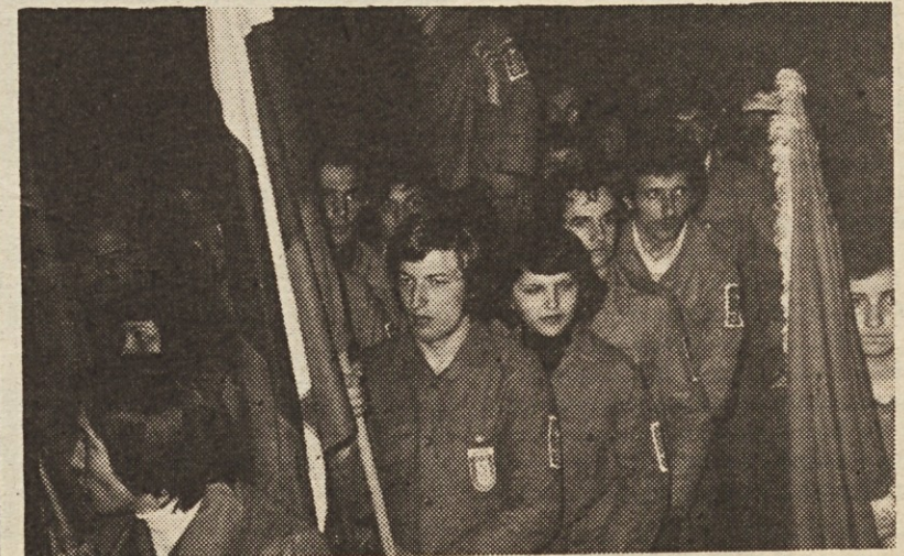
Vjko iz Iskre je bil zastavonoša brigade „Bratstvo — jedinstvo“, ki jo sestavljajo mladi iz elektro in elektronske industrije Jugoslavije.