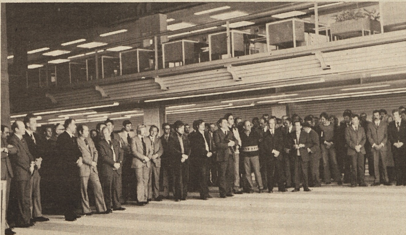
Udeleženci slavnostnega odprtja novega vhodnega objekta poslušajo govor generalnega direktorja.

Dvorana je izredno funkcionalna in primerna za najrazličnejša srečanja. Je izredno sodobna in prijetna, v njej pa je prostora za nekaj več kot sto ljudi. Gotovo je, da smo v Iskri še kako