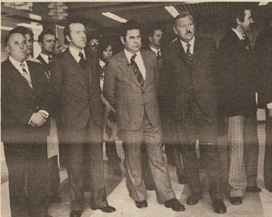
Slavnostni otvoritvi novega vhodnega objekta so prisostvovali malone vsi, ki so si prizadevali za dograditev naše stolpnice in vhodnega objekta, torej za dokončanje prve gradbene faze.