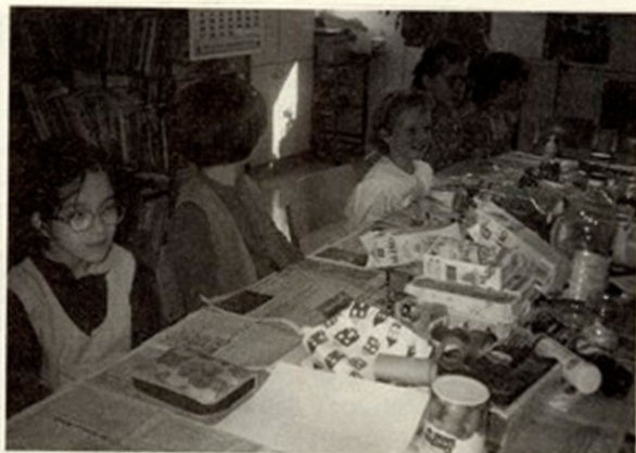
V šoli v Osilnici.