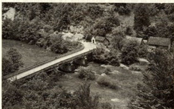
Most preko Kolpe v Mirtovičih leta 1961.

Gradbena posebnost vasi so sušilne jame za sadje. Od treh, ki so bile v vasi, je ohranjena in obnovljena le Mihejlava jama. Večji hiši v vasi sta Mihejlava in Andrejčkova, obe imata ganke. Ob Mihejlavi pa je vgrajena tudi kašča. V starih