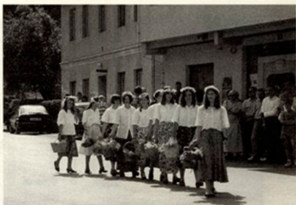
Lani so naša dekleta za Petruvu nastopila kot kresničke. Sodelovala bodo tudi letos.