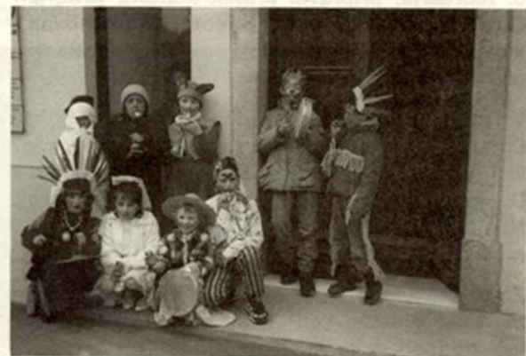
Za pusta so se otroci iz šole v Osilnici namaškarali.

Ta štiri leta, ko sem hodila na Podružnično šolo v Osilnico, so se vsako leto spreminjala. Prvi razred je bil težak. Učili smo se brati, pisati, računati. Drugi razred je bil lažji, ker sem znala