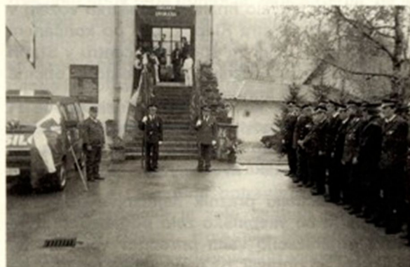
Četa Prostovoljnega gasilskega društva Osilnica z novim vozilom

Ob 10.30. uri se je na trgu pred občino postrojila četa Prostovoljnega gasilskega društva Osilnica.