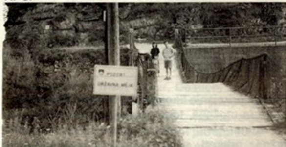
Viseči most na Grintovcu je ena naših znamenitosti.