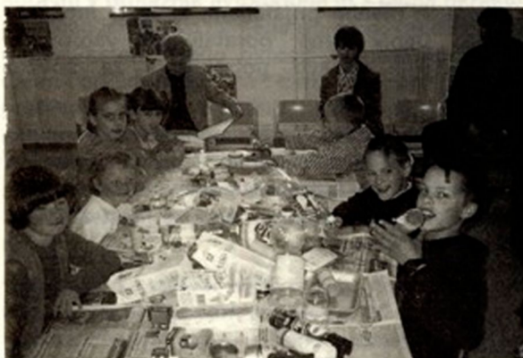
Trije učenci bodo letos končali štiriletno šolanje v Osilnici.