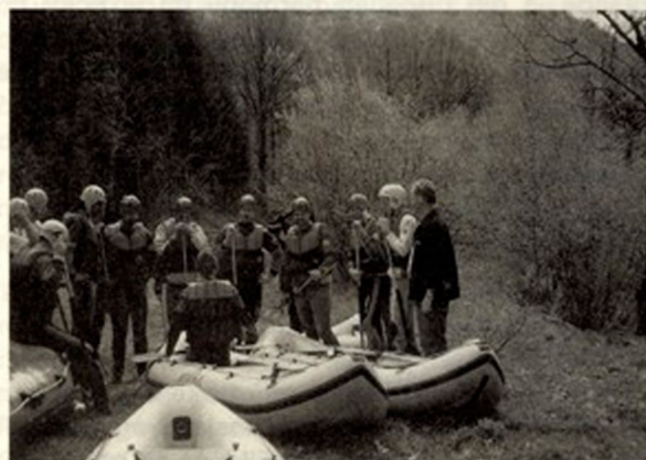
Pri organizaciji tekmovanja v kajakih in kanujih so pomagali tudi naši najmlajši

Izdajatelj: Civilno gibanje za Osilniško dolino Uredniški odbor: Olga Lenac, Jože Ožura, Mirjana Šercer, Stane Jarm, Katja Štimac - odgovorna urednica Priprava in tisk: Tiskarna Novo mesto Časopis izhaja v nakladi 400 izvodov in ga dobe občani brezplačno Žiro račun: 51300-621 11006/05 1320114-858250