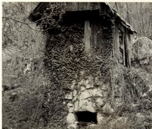
Mihejlava sušilna jama okoli leta 1965.

časih je bil prehod čez večno mejno reko Kolpo le s čolnom. Čolnišče, kot so imenovali mesto prehoda, je bilo ob samem izlivu potoka v reko. Leseni Mirtoviški most je bil zgrajen v drugi polovici 18. stoletja. Obnova oziroma gradnja današnjega slikovitega mostu je bila opravljena leta 1934. Lep betonski nosilni del s tlakovanim cestiščem so projektirali ruski inženirji. Gradnjo pa je izvajal zasebnik, zidar Andre Lenac iz Gašparcev (hiša je bila pri samem mostu, kjer je še vidno zidovje). Na stari most spominjajo le nosilni stebri - »babe«, sestavljene iz posebno oblikovanih in klesanih velikih kamnov. Med drugo vojno je bil most že pripravljen za miniranje. Da se to ni zgodilo, je bila zasluga prav njegovega graditelja. Med tehnično kulturno dediščino kraja spadajo vsekakor blizu 100 let stara Goršetova kovačija in še starejši mlini na potoku: Malenski, Lukežov in Jurgetov. Ob slednjem je tudi žaga, elektrarna ter pogonska vodna turbina. Ob tem se ni čuditi, da je ta del vasi od mostu dalje imel vzdevek »industrijska ulica« (o tem pa bo več napisanega v eni od naslednjih števil glasila). Najstarejši spomenik kulture pa je vsekakor cerkva Sv. Ane. Dan Sv. Ane, 26. julij, je tudi daleč naokoli znan, velik mirtoviški in krajevni praznik.