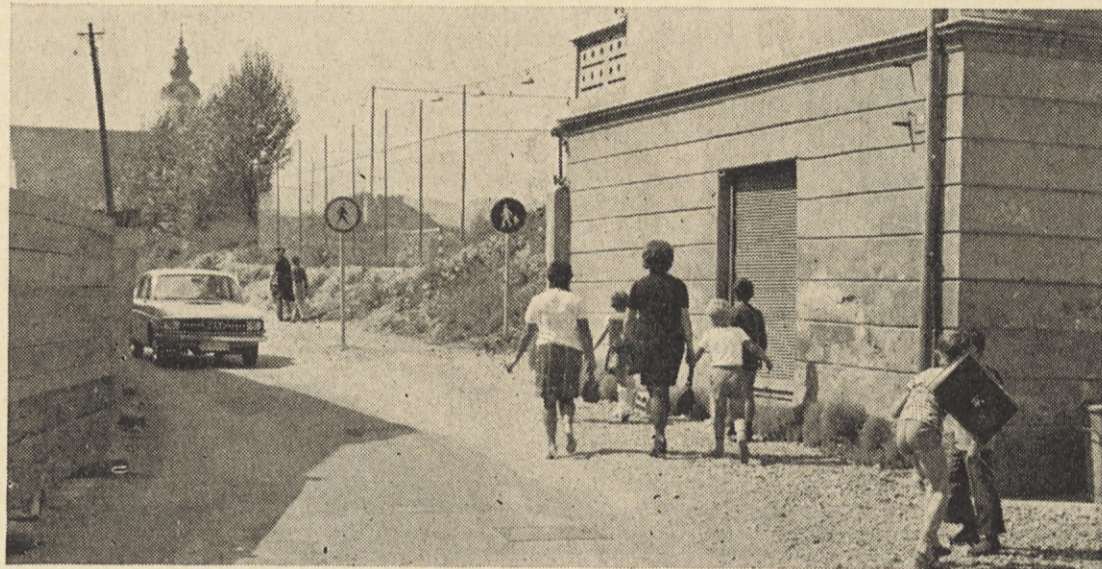
Veliko malčkov je letos prvič prestopilo šolski prag.