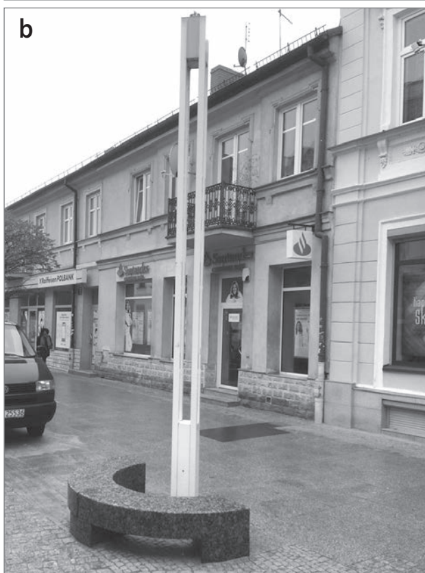
Sliki 5a in 5b: Klopi na Tumski ulici