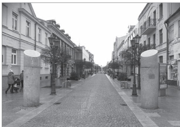
Slika 8: Pogled na Tumsko ulico