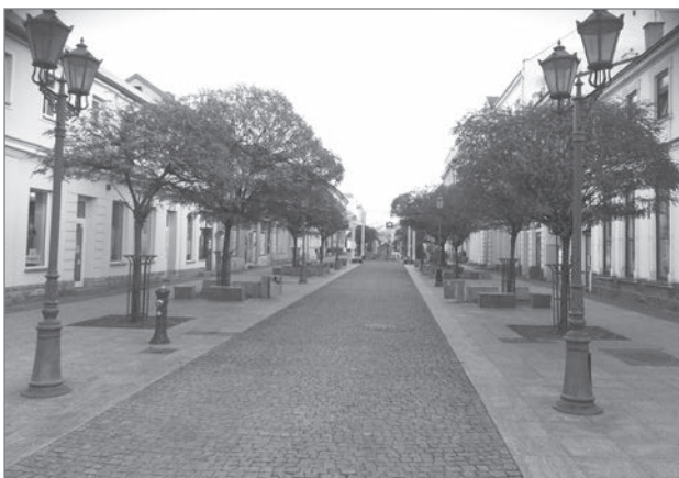
Slika 6: Opustela Tumska ulica