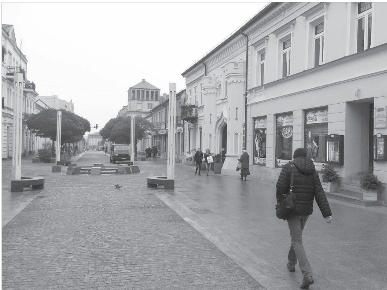
Slika 4: Različna površina in pešci na pločnikih Tumske ulice

FS2: M: Hlad? Zakaj ga čutite? Od kod prihaja?