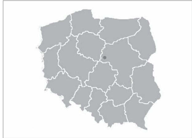
Slika 1: Plock na zemljevidu Poljske

delno nadomestile stare propadajoče objekte in so se ujemale s prvotnimi meščanskimi stavbami (Rydzewska, 2009). V prvem desetletju 21. stoletja so v Plocku hitro nastajali novi nakupovalni centri, zaradi česar so kupci zapuščali Tumsko ulico, ki je s tem izgubljala vlogo nakupovalnega središča mesta. Hkrati so mestne oblasti dale pobudo za projekt njene posodobitve, ki je bil dokončan leta 2006. Leta 2007 je prejel glavno nagrado na državnem natečaju posodobitve leta, mestne oblasti pa so prenovljeno ulico začele oglaševati pod reklamnim geslom dnevna soba mesta . Uveden je bil tudi program subvencioniranja prenove starih večstanovanjskih stavb (Woźniak, 2008). Razen sprememb v tlaku, ulični opremljenosti in zelenih površinah nadaljnji posegi kljub temu niso bili v celoti izvedeni. Poleg tega prenova ni bila samo množično kritizirana, ker je med prebivalci vzbujala močne negativne občutke (Woźniak, 2008; Tybura, 2019), ampak tudi ni zmožna zaustaviti družbenega nazadovanja ulice in upada njenega pomena v očeh prebivalcev. Leta 2012 so Tumsko ulico imenovali celo bančna ulica, saj je bilo na 326 m dolgem območju za pešce kar dvajset bančnih poslovalnic. Primanjkovalo je kavarn, trgovin in predvsem pešcev, kar je dajalo vtis prazne, zapuščene ulice (Woźniak, 2008; Marciniak, 2012).