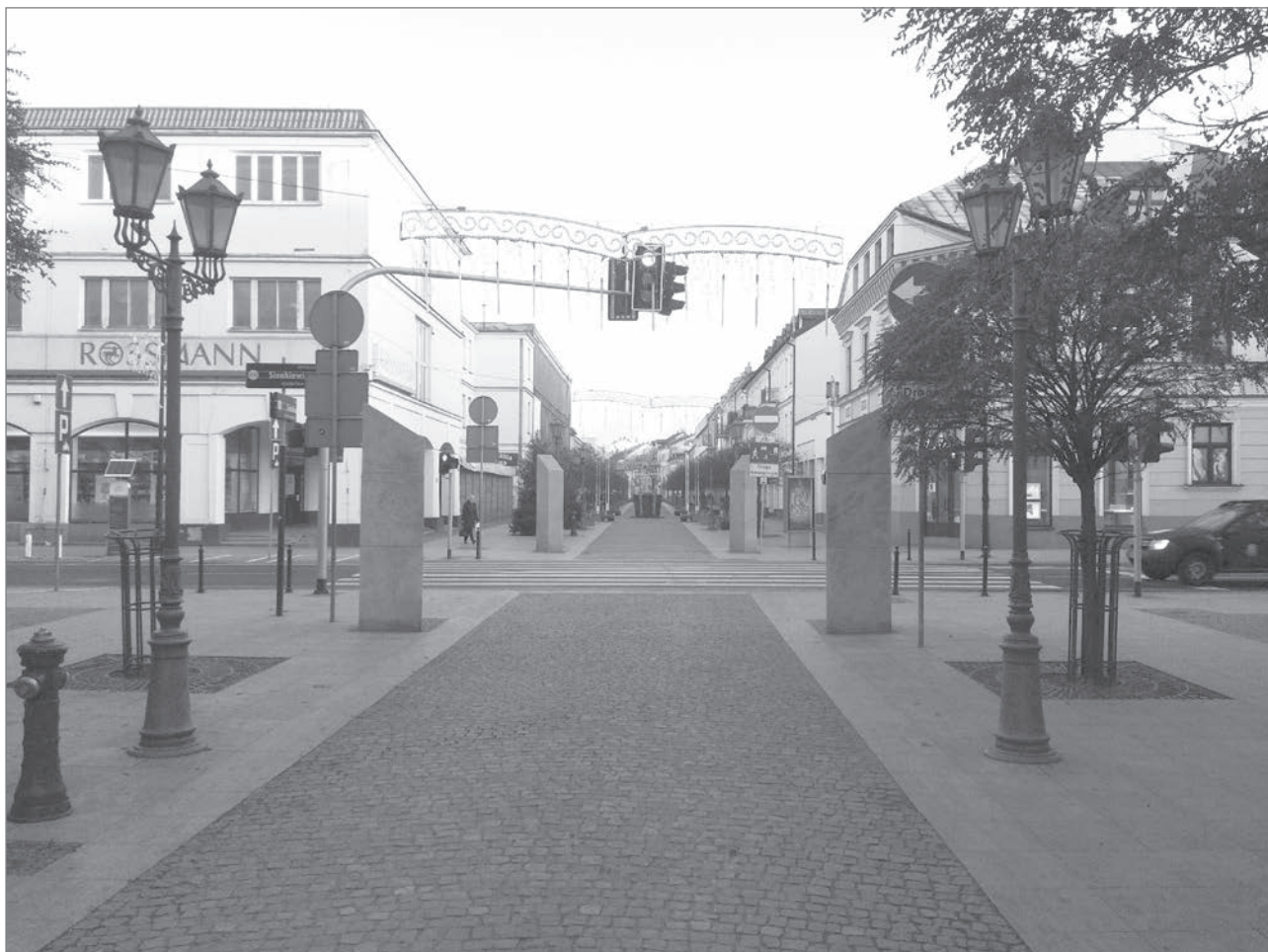
Slika 3: Kamnita Tumska ulica

skupinski raziskavi se lažje odprejo in navežejo stik z drugimi. Poleg tega navedena metoda udeležence spodbuja, da delijo svoje občutke in čustva (Gawlik, 2012) ter se o njih pogovarjajo. Navedeno pa je mogoče doseči samo, če vprašanja, ki se obravnavajo, niso preveč problematična ali intimna.