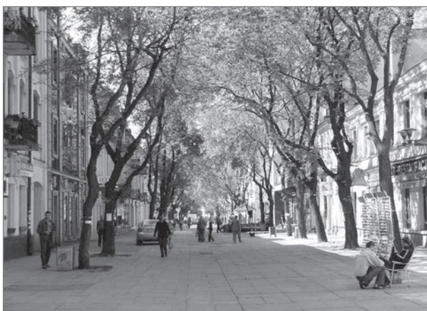
Slika 7: Tumska ulica pred revitalizacijo

Ko so bili udeleženci raziskave vprašani, kdaj se je po njihovem mnenju zgodila ta sprememba, so vedno poudarili, da po revitalizaciji. Zaradi prenove naj bi se spremenila narava ulice, ki je postala neprijazna pešcem. Zanimivo je, da se je nova, bolj estetska oblika ulice izkazala za čustveno manj sprejemljivo. Vprašani so pogosto poudarili, da je bila celotna prenova Tumske ulice bolj umetniška vizija arhitekta kot pa odgovor na družbene potrebe in pričakovanja.