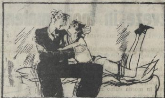
Moja malenkost in Cica, ko je prišla tako na konec, da je začela imeti opravka z literati.

Pomislite, kako naj poleg vseh drugih tegob odgovorim še na to vprašanje, ko sem zdaj s Cico vred ostal brez vsake pametne zveze — —.