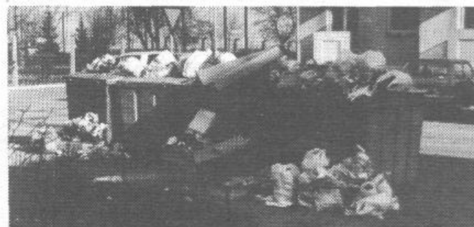
Deponija »prvomajskih praznikov« na križišču Kovinarske in Andrejaševe ulice kaže, da še nismo prav na dnu, ali pa morda ravno to.