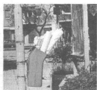
Simpatični sopek plakatov v smetnjaku blizu občine je posledica predvolilnih bojev. Škoda, ker je nameščen nekoliko »od roka«, saj ga odgovorni že nekaj časa niso izpraznili. Logično bi bilo, da ga praznijo komunalci, vendar se pri nas zadnje čase nič več ne ve kdo je za kaj odgovoren: KS, občina, ali komunalci.