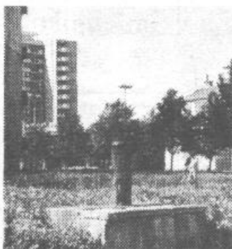
Njega dni so vodnjake kot je na posnetku, obnavljali zaradi SLO. Potem, ko so »poveljniki« ugotovili, da nas ne bo nihče napadel, ker se bomo uničili sami, je tudi interes za vodnjake uplahnil in so sredi mesta ostali samo kot spomin na žalostne zablode.