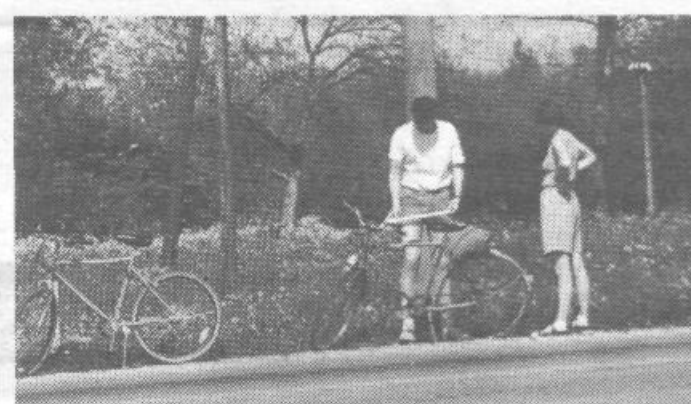
Predrta zračnica na lepem spomladanskem izletu ni nič nenavadnega, lahko pa je tragično, kot v našem primeru, ko sta potnika ugotovila, da je tudi tlačilka čisto fuč.