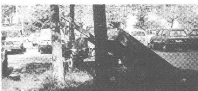
Nekoč smo v Javni tribuni že objavili sliko prikolic, ki jo je iznajdljivi lastnik Ob zici priklenil k drevesu. Verjetno je bila fotografija in ideja všeč tudi drugim lastnikom prikolic in glej ga vruga - čedalje več je posnemalcev.