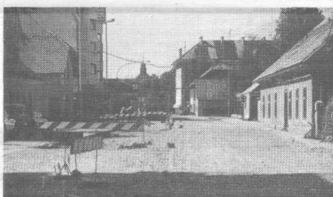
Prušnikova cesta v Sentvidu je vedno hvalečna tema za naš fotoutrip. Še od tedaj, ko se je imenovala Celovška. Ampak tako temeljito kot so jo »sesuli« tokrat, se nismo imeli priložnost videti. S tamkajšnjimi kraji vred tiho upamo, da bo še letos vsaj tlakovana kot je bila za časa tramvaja, če že ne bo asfaltirana.