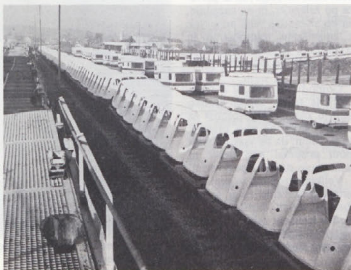
Delo na tovorni postaji IMV je zaživelo. Vsakdanji prizor odprema gotovih izdelkov in drugega materiala za izvoz.