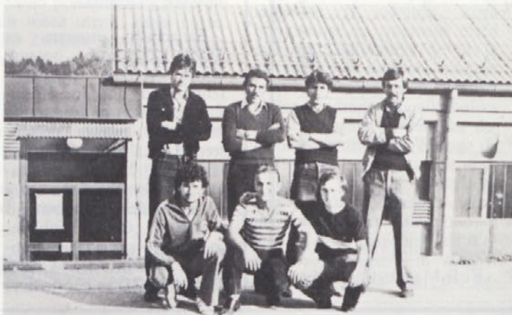
Zmagovalna ekipa TOZD TA – proizvodnje IV (lakirnica) v malem nogometu.