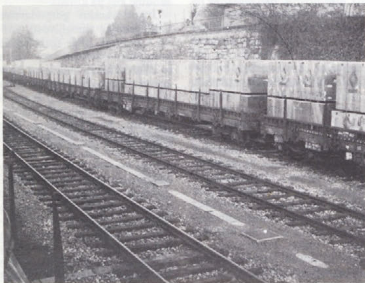
Vlak, naložen s kolekcijami za proizvodnjo osebnih vozil, čaka na odločitev. Železnica pa z vozovno zamudnino nič ne čaka.

Našo vlogo za določitev carinskega prostora smo podkrepili z dejstvi, da nam bo potem omogočeno ažurno razkladanje