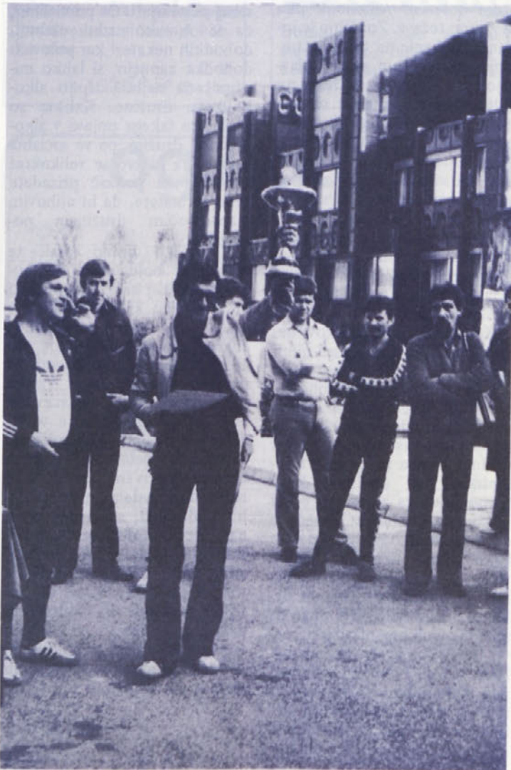
Prehodni pokal v rokah zmagovalcev, za prihodnje leto pa so že napovedali za ponovno selitev. Bomo videli.