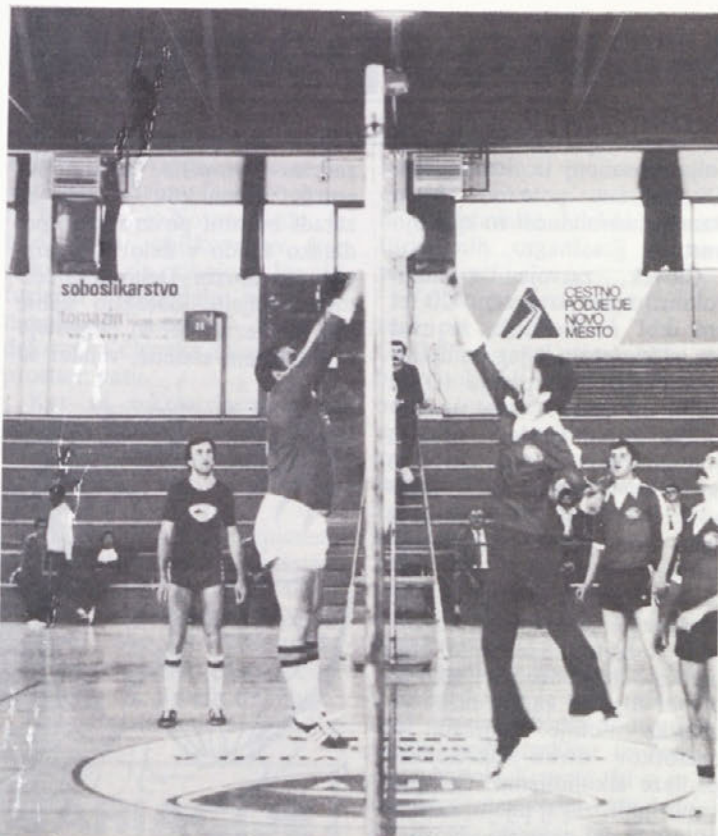
Kot je videti s posnetka, so se odbojkarji zavzeto borili za vsako točko.