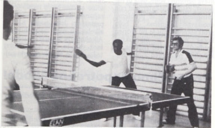
V moštvih je bila tudi mednarodna udeležba, žogica pa je bila enako okrogla za vse.