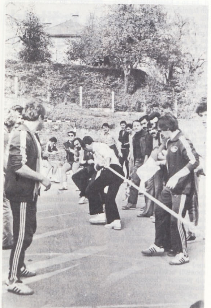
Brežičani so potegnili pokal.