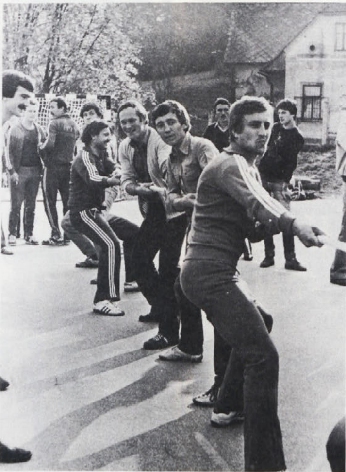
Veselo razpoloženje v ekipi DSSS pri „štriku“.

Odbor za obveščanje predlaga delavskemu svetu, ki v delovni organizaciji odloča o sredstvih, finačni načrt obveščanja in ga seznanja z načinom porabe sredstev, predvidenih za obveščanje.