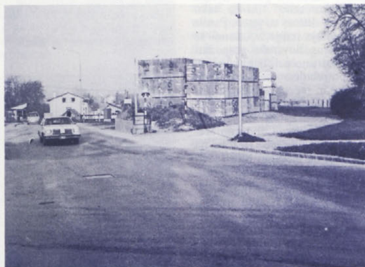
Postaja Novo mesto: takšen prostor za skladiščenje kolekcij bi se našel tudi v IMV. Odpadli bi nepotrebni stroški skladiščenja in transporta, pa še sitnosti s prevozom skozi mesto bi odpadle.