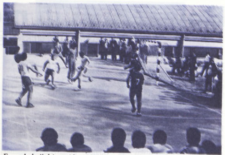
Ena od akcij, ki se ni končala z zadetkom.