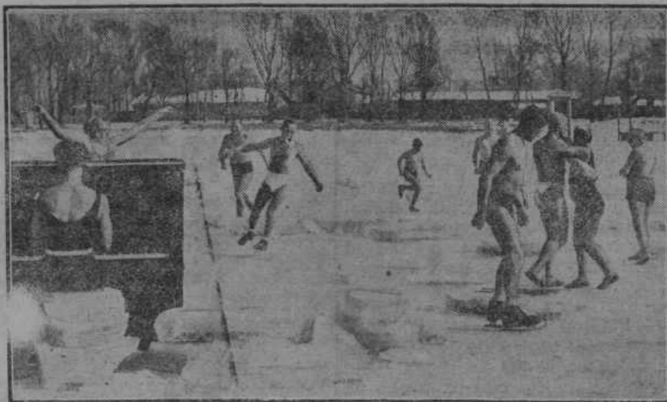
Na Dunaju so drsali po ledu pri 10 stopinj mraza.