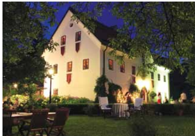
Slika 4: Kendov dvorec.

Ob številnih danostih, ki jih Idrija že izkorišča za krepitev atraktivnosti svoje turistične ponudbe, pa se bo v prihodnje bolj kot doslej morala posvečati priložnostim, ki jih doslej še ni uspela izkoristiti. Cilj je zlasti povečanje prenočitvenih kapacitet v sobah, apartmajih, gostiščih, podeželskih hotelih ter izgradnja mestnega hotela in mladinskega hotela ( youth