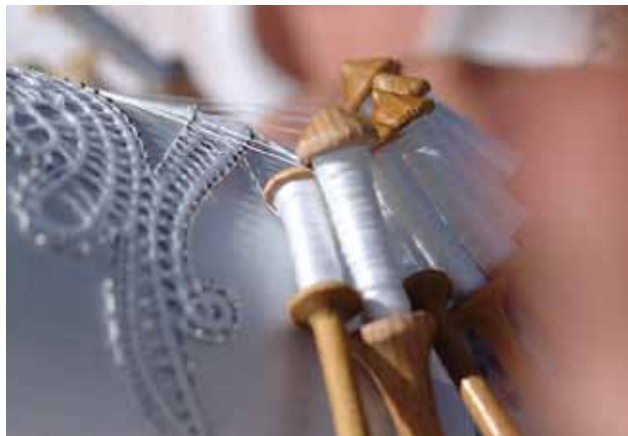
Slika 3: Klekljanje.

in mesto, ki ga Idrija zaseda kot eno izmed osrednjih klekljarskih središč Evrope in sveta.