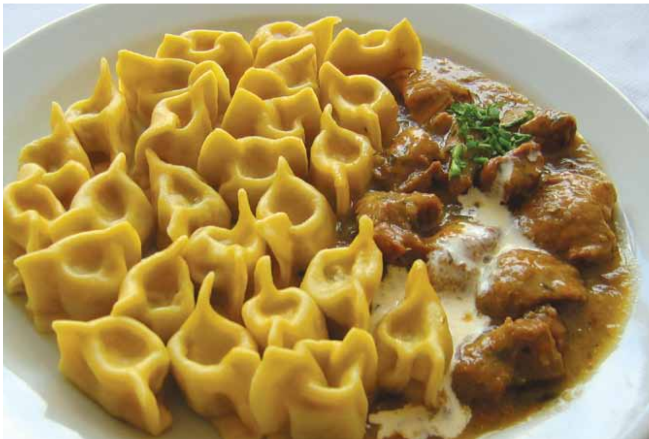
Slika 2: Idrijski žlikrofi.

Festival idrijske čipke je osrednja etnološka, gospodarska, kulturna, izobraževalna in zabavna prireditve, posvečena idrijski čipki. Tridnevna festivalska dogajanja v mesecu juniju po svoji vsebinski plati predstavljajo preplet dveh časovnih plasti idrijske čipke: ohranjanja in predstavitve zgodovine izdelovanja čipke v Idriji, njenih tradicionalnih vzorcev, tehnik in rabe na eni strani ter sodobna dogajanja in raziskovanja na področju idrijske čipke, ki se odražajo v oblikovanju novih vzorcev, uveljavljanju blagovne znamke, mednarodnem projektne povezanju z drugimi evropskimi klekljarskimi središči in uveljavljanju idrijske čipke kot prestižnega izdelka v svetu mode ter protokolarnih in poslovnih daril na drugi strani.