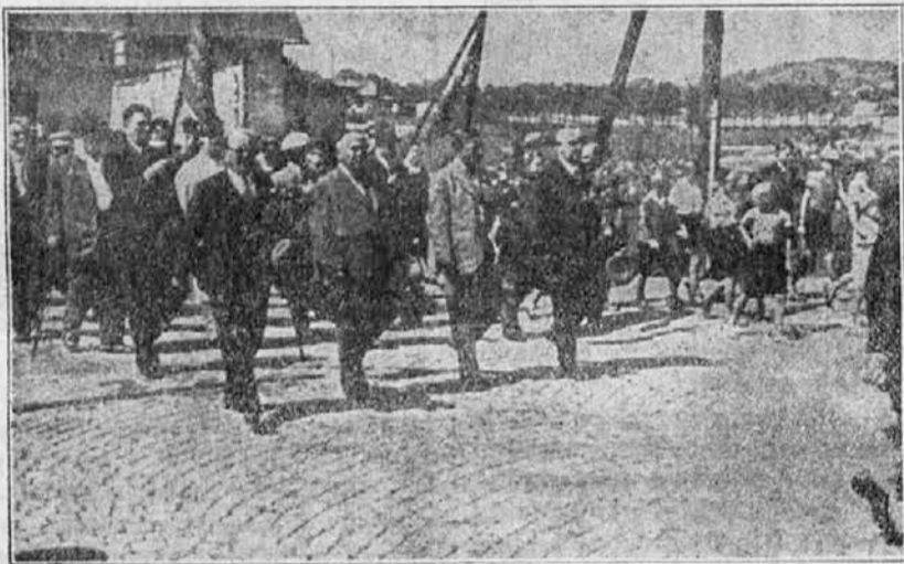
Predsedstvo Državne zveze čehoslovaških gostilničarskih združenj z zastavami o priliki zborovanja v Novi Paki

kdo izmed naših in precej številnih nezadovoljnih oglašil s trditvijo, češ, da se godi čehoslovaškim gostilničarjem bolje, zato prinašamo v naslednjem resolucije, ki so bile prečitane in sprejete na tem zborovanju. Resolucije se glase tako-le: