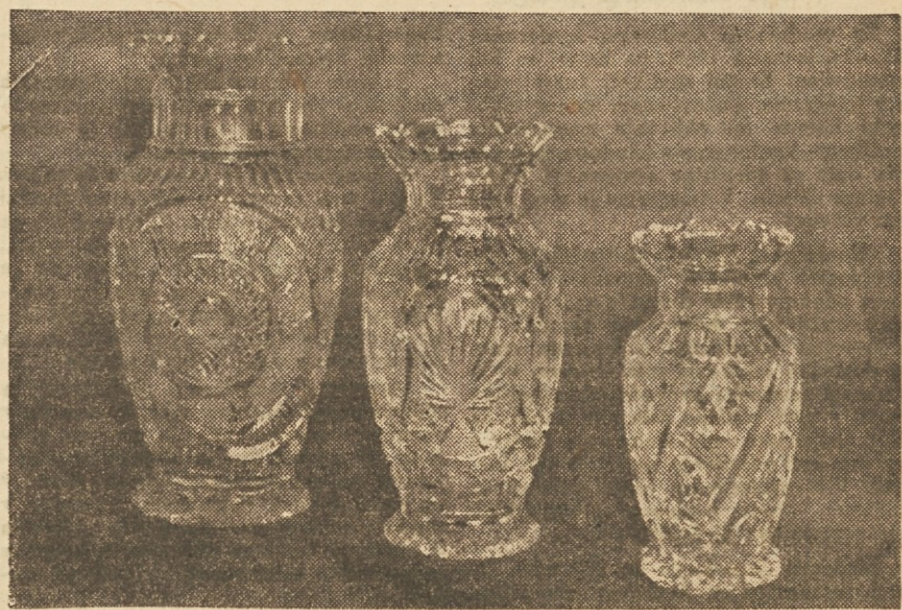
Umetno brušene vaze, izdelane iz najfinejšega svinčnega stekla v Rogaški Slatini, prav nič ne zaostajajo za inozemskimi proizvodi.

obratu brusilnica, kjer je zaposlen največji odstotek vsega delavstva steklarne, je bil uveden brigadni način dela letos v februarju. Po storilnosti in kakovosti dela prednjačijo brusilnice. Dve brigadi za najboljše steklene izdelke,