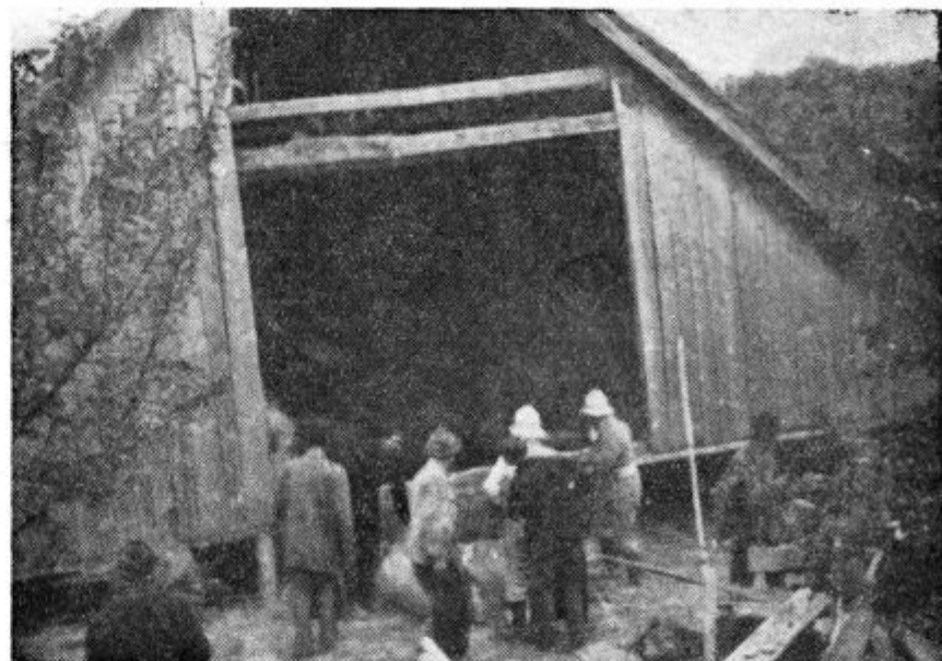
Težko ostrešje in seno je zatrpalo vhod v hlev, odkoder gasilci in sosedje s težavo rešujejo živino.

bila zavarovana, razen proti požaru in še to le za 900 tisoč dinarjev. Tudi živina je bila nizko zavarovana.