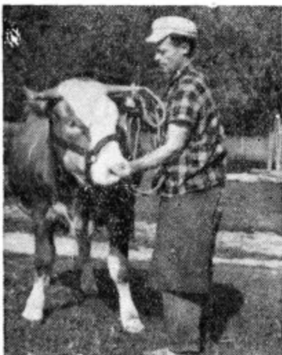
Ni izključeno, da bo dobil nagrado za svojo kravo tudi živinorejec na naši sliki.

V okviru prireditve predvidevajo razstavo, ki bo prikazala razvoj živinoreje, konjereje, prašičereje in perutninarstva zadnjih nekaj let v Slovenskih goricah. Živino za razstavo na prireditvi bodo predhodno ocenili. Program predvideva, da bi prvi dan ocenjevali živino in določili, kateri živinorejci bodo prejeli nagrade za najboljšo razstavljenjo živino. Nagrade bodo prispevale gospodarske organizacije in ustanove. 3. september bi naj bil predvsem komercialnega značaja. Živinorejci in ostali bodo imeli priliko videti način prodaje živine na veliko. Predvidevajo, da bo prišlo večje število kupcev tudi iz sosednjih republik. Celotna prireditev bo v Zamarkovi, kjer ima zadruga ustrezne hleve za 250 glav živine, ki bo razstavljenja. Živinorejci si bodo lahko na razstavi ogledali tudi grafikone z izračuni načina vzreje in rentabilnosti živine ter močnata krmila, ki jih polagamo živini kot dodatno krmo. Poleg tega nameravajo vrteti strokovni film. Verjetno pa bodo pripravili tudi večjo tombolo z veselico v lepem naravnem okolju. Podrobno o tej prireditvi bomo poročali v prihodnji številki.