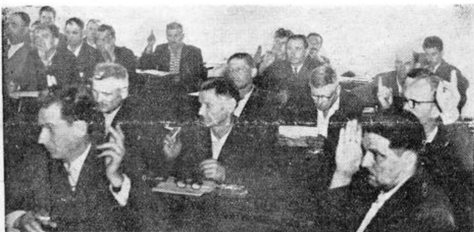
Odborniki obeh zborov ljudskega odbora glasujejo za razrešnico nekaterih vodilnih uslužbencev v gospodarstvu in delavski univerzi