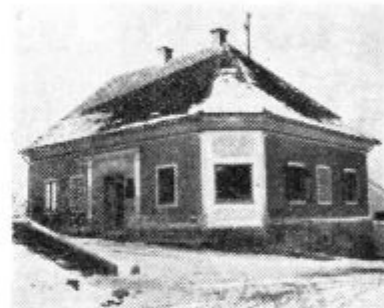
Sedež Kmetijske zadruge Zg. Ščavnica-Velka v Zg. Ščavnici.

zadruga pa samo za 1.000 din. Navzoči so ugotovili, da porast osebnih dohodkov ni bil v sorazmerju s produktivnostjo, ker se ta ni dovolj povečala.