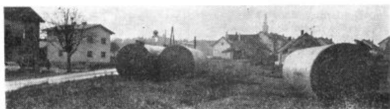
Na kraju, kjer ležijo zdaj sodi, bo v Lenartu čez nekaj mesecev stala sodobna bencinska črpalka.

V Ljubljani bo zborovanje samoupravljalcev Slovenije, na to zborovanje bo iz naše občine šlo 15 oseb, izbrali pa jih bodo na 100 zaposlenih po enega.