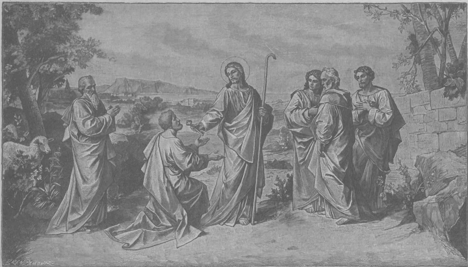
Jezus izroči sv. Petru poglavarstvo sv. cerkve.