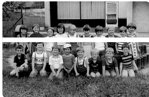
Fotografija 1: Moja vrtčevska skupina leta 1978/1979, vzgoja za istospolnost?

Opomba k fotografiji: Avtoričin istoimenski prispevek v delu Bahovec, Bregar Šola in vrtec skozi ogledalo (2004), v katerem med drugim opisuje različne pristope pri izobraževanju predšolskih vzgojiteljic o homoseksualnosti.