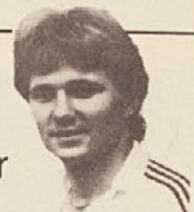
PIŠE SILVO KUMER

V soboto, 17. marca, bi moral biti začetek prvenstva v koroški ligi, teden pozneje pa v obeh podligah. Toda kaže, da prvenstva še nekaj časa ne bo. Nekatera igrišča so sicer že kopna, toda večina še vedno leži pod ledeno in snežno odejo. Funkcionarji koroške nogometne zveze so spet prezkodaj nastavili termine za začetek prvenstva. Čeprav je v preteklih letih bilo