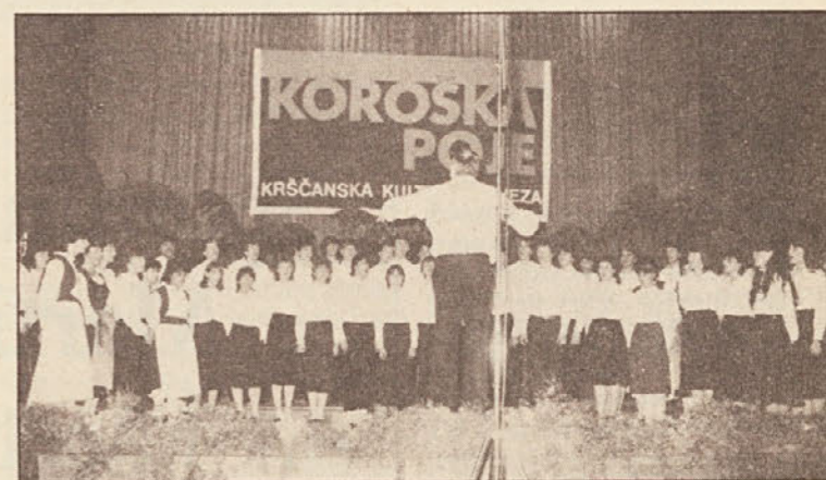
Mladinski zbor Slovenske gimnazije.