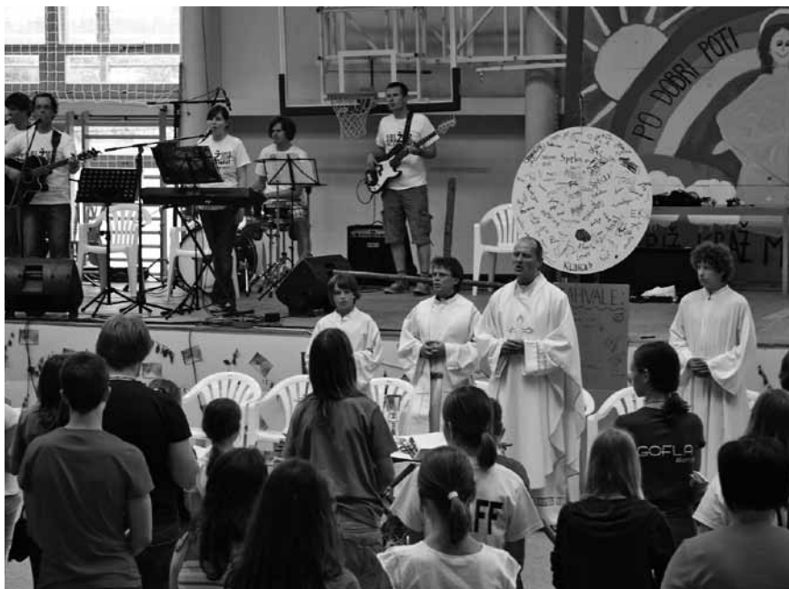
Mladi so se na Križ kražu razživel ob igrach, delavnica in drugih radostih.