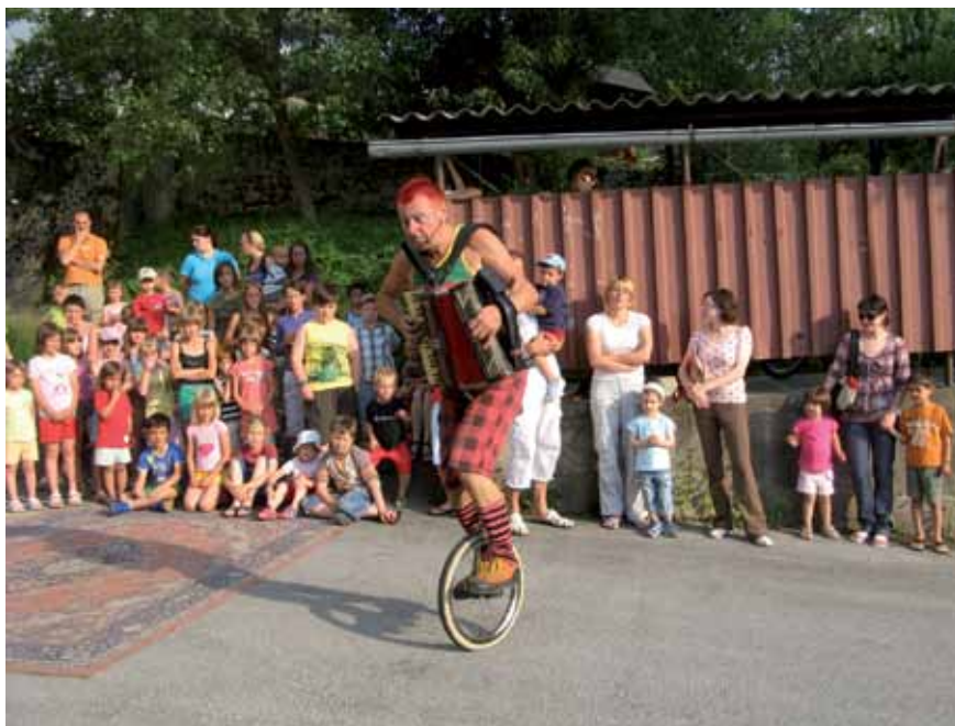
Tole pa ni tako enostavno.