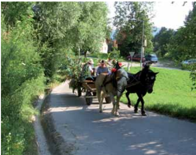
Tako so se včasih mladi fantje odpeljali na vojaški nabor.

K ulturno-turistično društvo Hotedršica je 27. junija pripravo že 17. Kresno nedeljo, ki so jo letos naslovili Kako bom soldat. Na etnološko obarvani prireditvi so si obiskovalci lahko ogledali pravo štelengo, šego, ki je bila nekoč običajna, s profesionalizacijo vojske pa je povsem izginila. Že dan prej pa so se Hotenjci poveselili na prireditvi Rajajmo z gasilci.