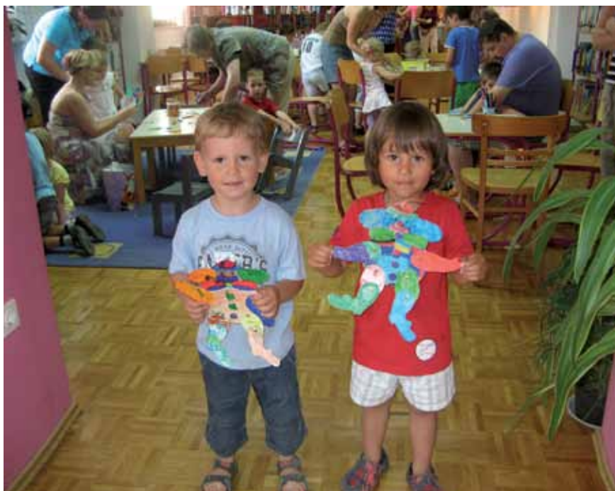
Poglejte, kako sta lepa najina klovn.