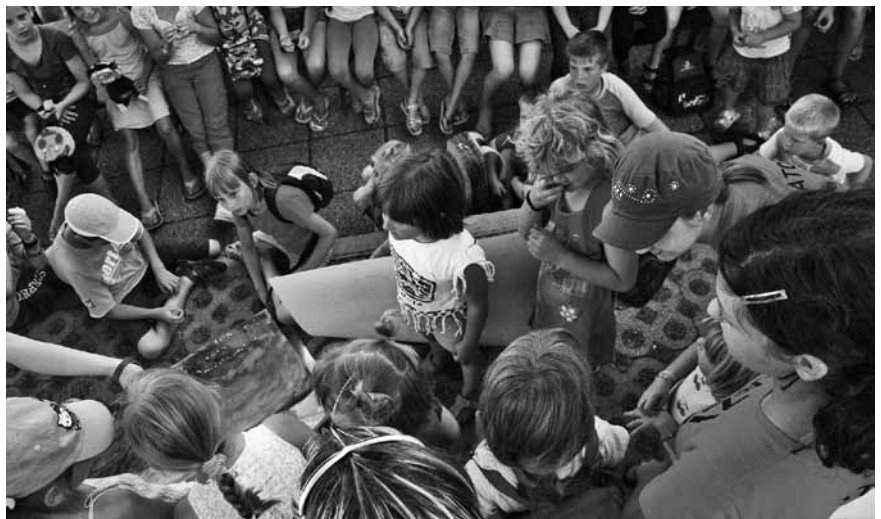
Na oratoriju v Dolnjem Logatcu se je tudi letos trlo otrok.