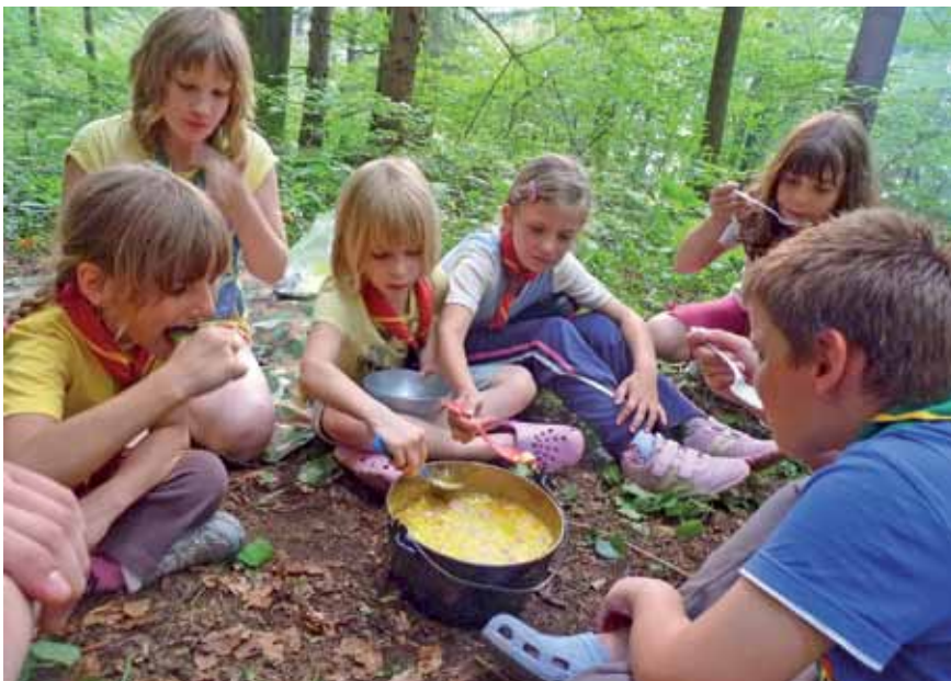
Tako malce starejši kot najmlajši taborniki si morajo sami znati pripraviti obrok. Zelenjavna juha je bila zelo okusna.

Taborniki logaškega rodu Srnjak so letos pripravili že 16. samostojno taborjenje – Otroci se učijo taborniških spretnosti, samostojnosti, sodelovanja v skupini in življenja v šotoru