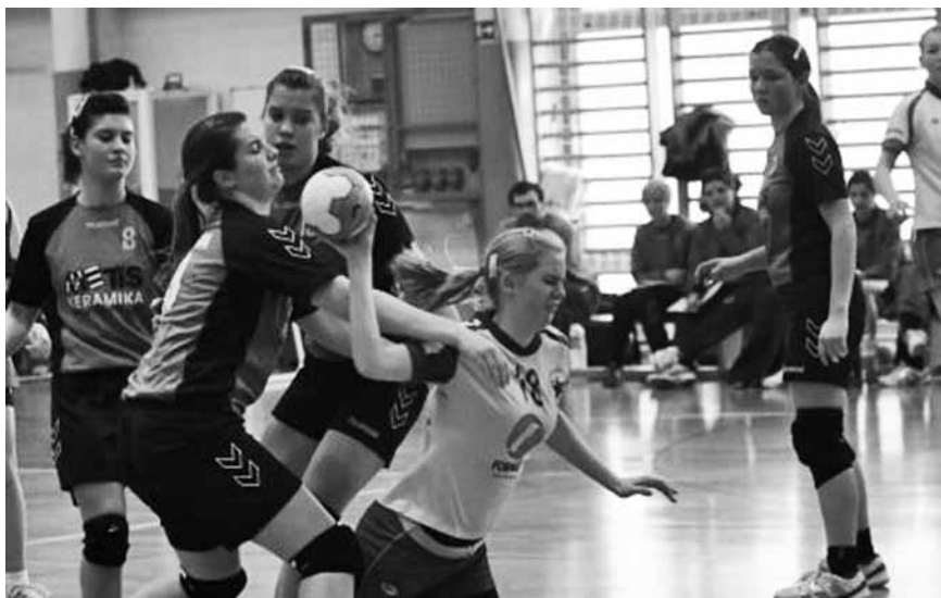
Rokometnišice uspešno zabijajo gole.

Prizadevni trenerji v klubu poleg vadbe in tekmovanja organizirajo še veliko drugih aktivnosti, kot so tabor za najmlajše na morju, prvomajski izlet v Gardaland, udeležbo na raznih turnirjih v Sloveniji in tujini. Pred začetkom nove tekmovalne sezone bodo dekleta nabirala kondicijo na Rogli.