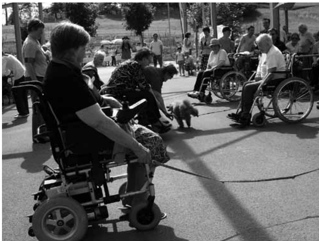
Obiskale so nas Tačke pomagачke, vodniki s svojimi psički.

Potekalo je tudi praznovanje rojstnih dni stanovalcev, rojenih v mesecu juniju in juliju; praznovali smo ga vsi slavljenci skupaj. Tudi ta mesec so organizirali prevoz na sejem v Logatec. Obiskal nas je otroški pevski zbor OŠ 8 talcev Logatec. Zbor je velik in šteje okoli 30 učencev, ki so iz prvega, drugega in tretjega