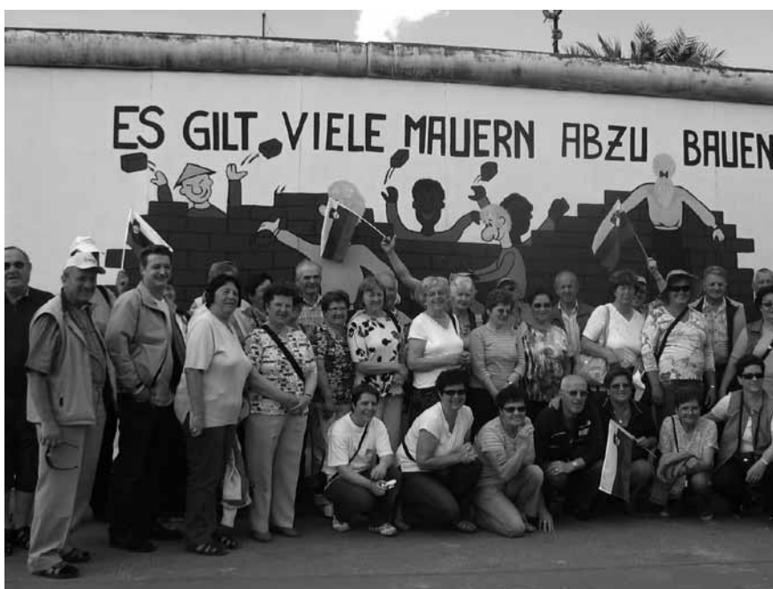
Logaški romarji ob Berlinskem zidu.