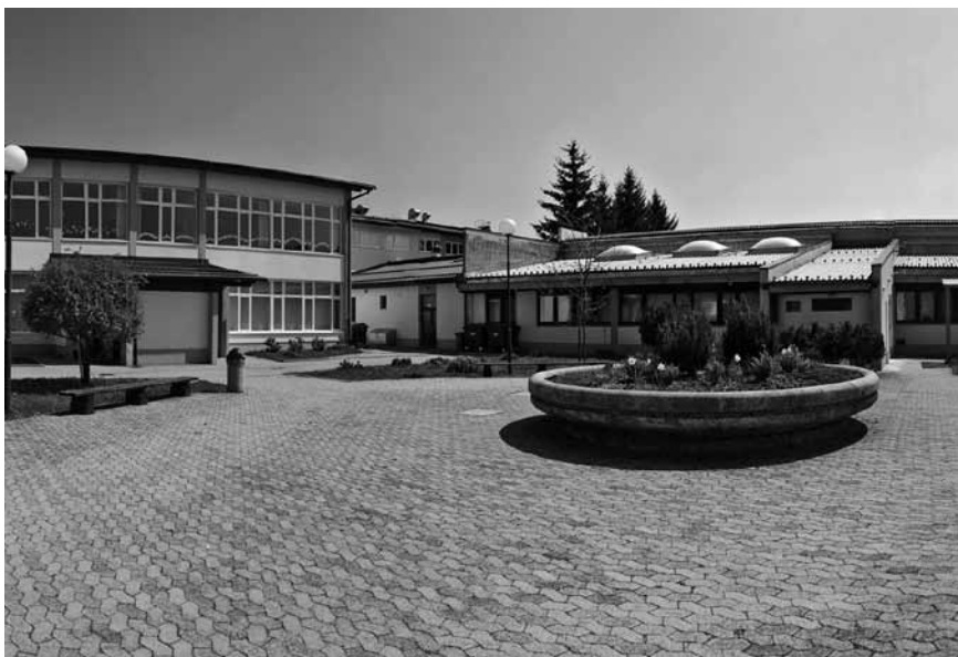
Osnovna šola Tabor v Gornjem Logatcu.

Literarno področje: državno priznanje na natečaju šolskih glasil JSKD šolskemu glasilu Žvrgolač.