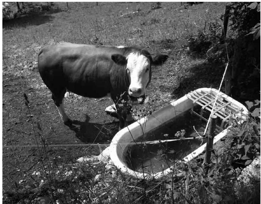
Ob poletni vročini potrebujejo krave precej več vode kot običajno, saj se poleg velike količine vode potrebne za prirejo mleka povečajo potrebe za hlajenje telesa..