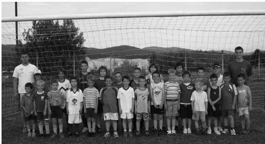
Nogometni teden je na Sekirico privabil številne najmlajše.

V Centru vojnih veteranov Slovenije je bil 3. julija že drugi turnir v malem nogometu. Na asfaltni površini se je pomerilo 16 ekip, ki so prišle iz Logatca, Kopra, Postojne, Ljubljane, Vrhnike in od drugod. Ekipa so najprej tekmovala v okviru svo-