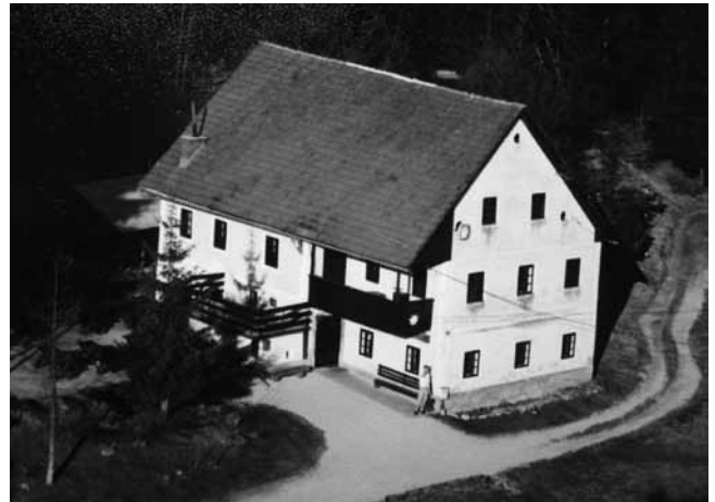
Planinski dom Cajnar je včasih gostil tudi srečanja za praznik dela.

»Gozdna cesta, vožnja na lastno odgovornost«, piše na tabli, ko se na cesti iz Kalc proti Kališem začne makadam. Najprej gre v hrib, nato se odpre pogled na travnike, nekaj hiš in manjši sadovnjak. Na koncu večje jase pot zavije desno, kjer stoji tabla