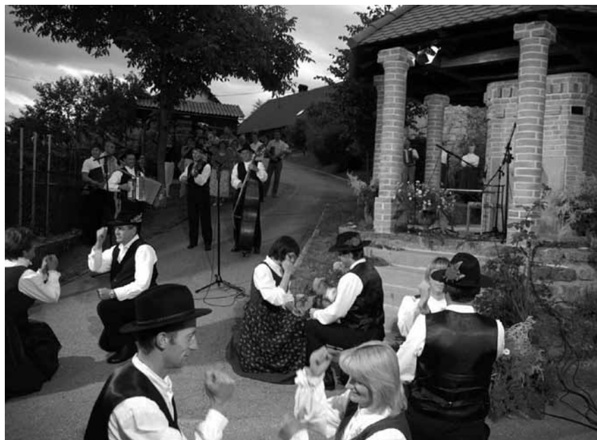
Pri vodnjaku na Čevici so zaplesali Hotenjci.

Ko se je mrak dodobra znočil in se je sv. Jožef v ozadju razsvetlil, kot bi ga razžareli šentjanževi kresovi, je gostiteljski zbor zapel Ipavčevega Slovenca, da je tako pozdravil naš državni praznik. Vsaj toliko