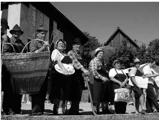
Utrinek z enega od prejšnjih Kmečkih praznikov.