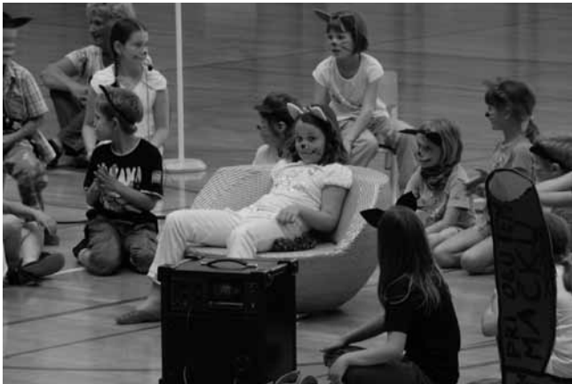
Mucke in mucki na zaključni prireditvi.

V okviru projekta Maček Muri smo na osnovni šoli v Dolnjem Logatcu med drugim uprizorili dele znane pravljice Kajetana Koviča