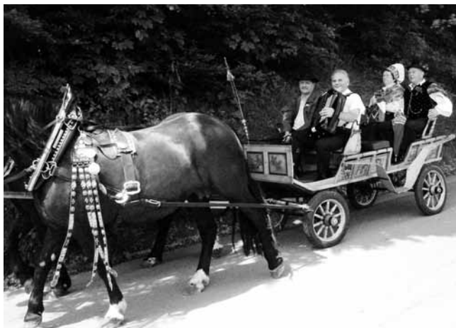
Na slavlje sta se popeljala z zapravljivčkom.