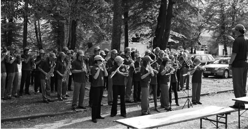
Logaški pihalci so v Grajskem parku zaigrali tudi na Srečanju godb 2010.

Pod šotorom v Grajskem parku se je razlegala filmska glasba, ki so jo na platnu podkrepili prizori iz filmov