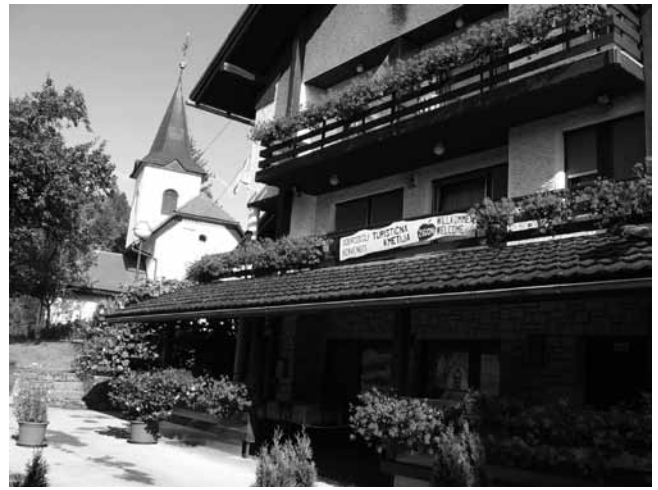
Pri Žigonovih v Grčarevcu pogosto prespijo ribiči, ki jih mika ribolov na Unici.