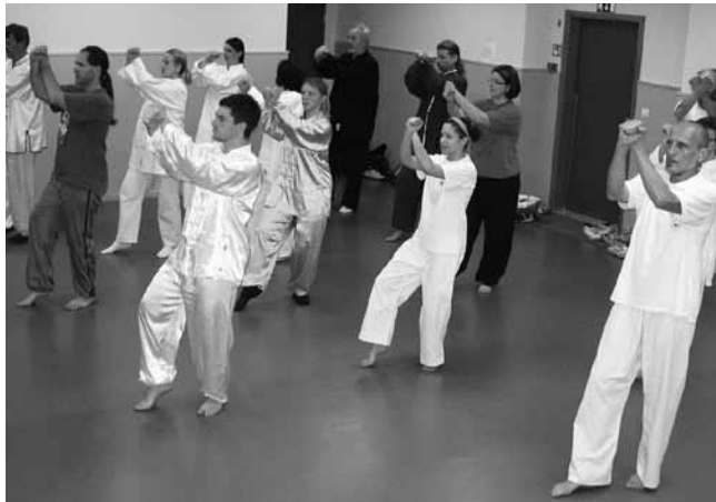
Ljubitelji qigonga in taijiquana pri vadbi v vrtcu Kurirček v Logatcu.

V Logatcu in Postojni zaključujemo tretje leto uspešne vadbe in spoznavanja večšin iz bogate kitajske kulture. Qigong (QG) in taijiquan (TJQ) v Sloveniji že šestnajsto leto poučuje kitajski mojster in mednarodni sodnik kitajskih borilnih veščin