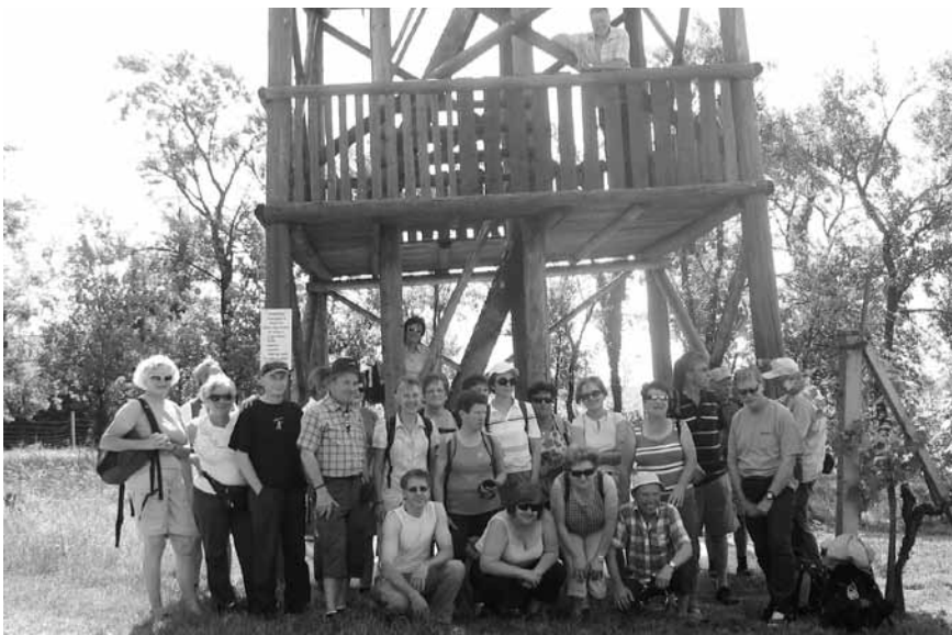
Planinci ob stolpu v Bogojini.