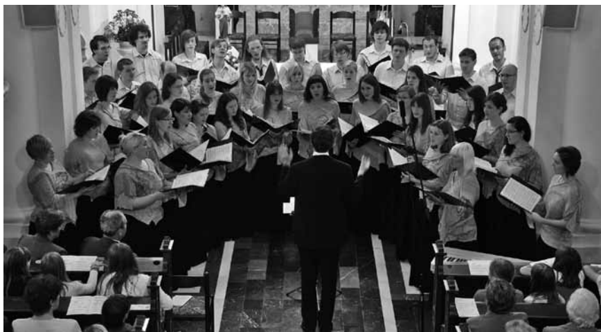
Pevci Akademskega pevskega zbora Tone Tomšič so s svojim nastopom poželi buren aplavz.

Dogodki so bili dobro obiskani, o na- stopajočih je bilo podanih veliko zanimi- vih informacij, saj je občinstvo koncertno dogajanje spremljalo z lično izdelanimi