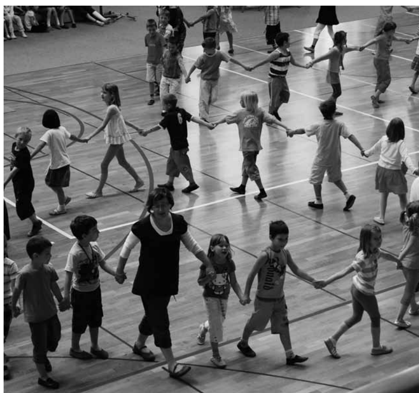
Od šole so se poslovili s prisrčno prireditvijo.

P ogosto potujemo po svetu, opevamo lepoto tujih dežel, se čudimo tuji kulturi in stvaritvam narave ter pozabljamo, da na domačem pragu prav tako lahko najdemo veliko lepega in zanimivega. Ali poznate kraj, v katerem živimo? Ali veste, od kod izvira ime Logatec, kdo so bili furmani in kaj so počeli? Ste se že kdaj vprašali, kdaj so bile tu postavljene prve zidane hiše in koliko let lahko skozi Logatec potujemo z vlakom? Kakšna je njegova zgodovina in katere naravne in kulturne znamenitosti si v njem lahko ogledamo?