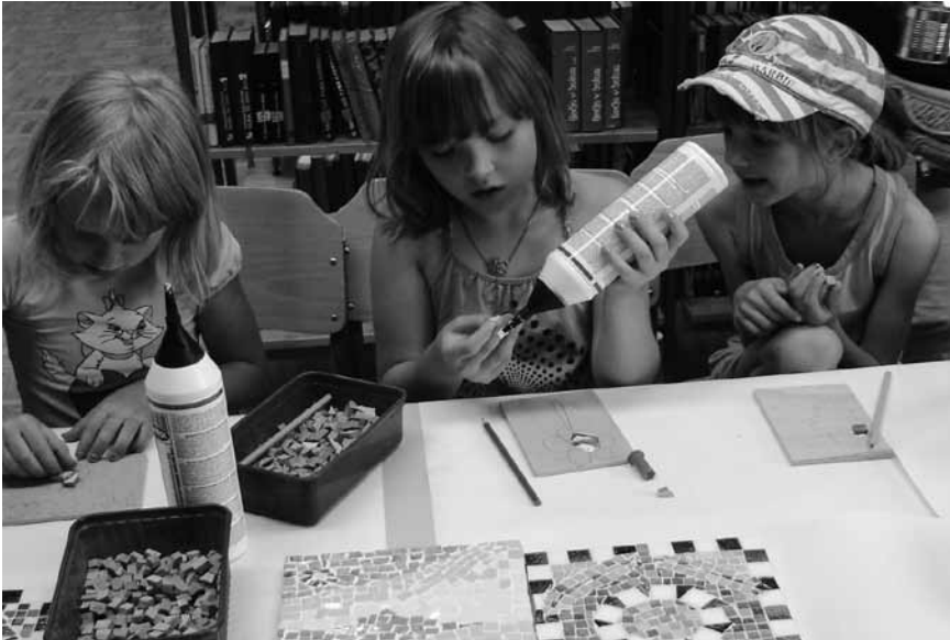
V Rovtah so otroci, bilo jih je 19, ustvarjali mozaike.

Oratorij dobro obiskan, delavnice JSKD v Logatcu pa precej slabše – Za poletno varstvo otrok ni bilo odziva