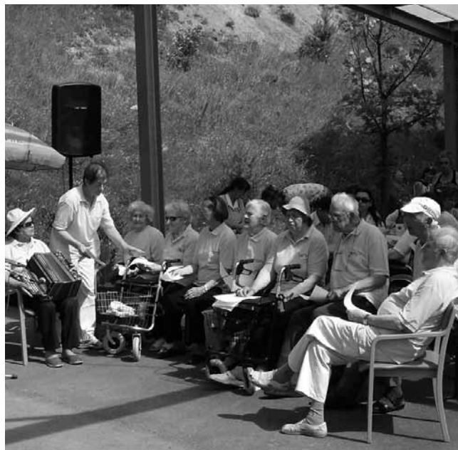
Tradicionalnega piknika smo se zelo razveselili.

razreda. Otroci so zapeli precej lepih pesmi. Ta pevski zbor je pri nas že nastopil in so zelo prijetni. Obljubili so nam, da še pridejo. Otroke smo obdarili z medvedki in punčkami, ki jih pri nas naredijo stanovalke. Nam, stanovalcem, so zelo lepo popestrili popoldne.