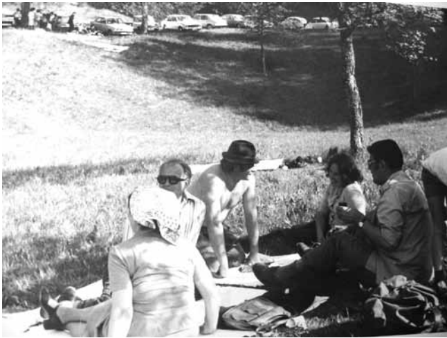
Tako je bilo leta 1979 v Kališah.

Tončkov dom je bil konec petdesetih let prejšnjega stoletja dodeljen organizaciji zveze borcev. Ti so ga obnovili s pomočjo Klija in Valkartona, največ pa je bilo prostovoljnega dela, zgradili so balinišče, uredili prostor za prireditve. Dobro uro hoda je bilo do tja. Prirejali so srečanja, vse leto je bilo živahno. Sredi devetdesetih let je bil dom v procesu denacionalizacije vrnjen lastniku in je za obiskovalce zaprl vrata. Balinišče je prerasel mah, celo skrinjo za planinski žig je nekdo odstranil.