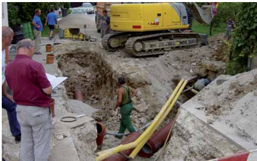
Vse kaže, da bo občini jeseni le uspelo dobiti kohezijska sredstva za gradnjo čistilne naprave Logatec in kanalizacije, tako da bo v prihodnjih letih podobne prizore videti na Martinj hribu in Kalcah, pozneje pa tudi v Rovtah, Grčarevcu in Lazah.