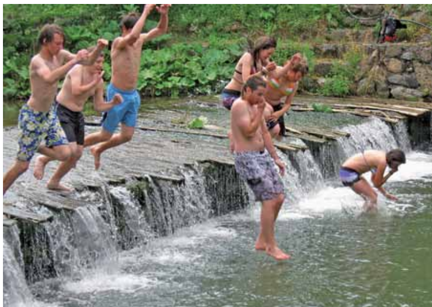
Kopanje je tudi na taborjenju obvezno in vedno zabavno. Na letošnjem taborjenju je osvežitev nudila reka Drete.