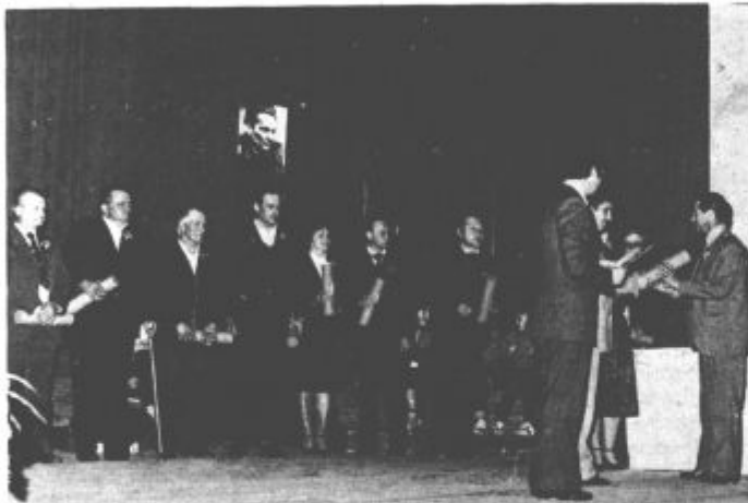
Desetim zaslužnim članom so podelili priznanja

Pri Ocepku je bilo tradicionalno kresovanje, ki se ga je udeležilo preko 300 tujcev. Slovesnost ob krajevnem prazniku so zaključili v nedeljo s tekmovanjem v atletiki in malem nogometu. B. Z.