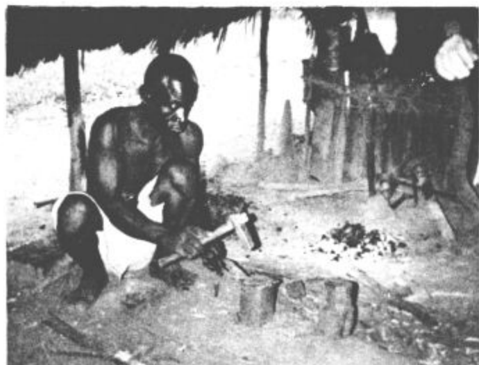
Tako kujejo Afričani ob obali