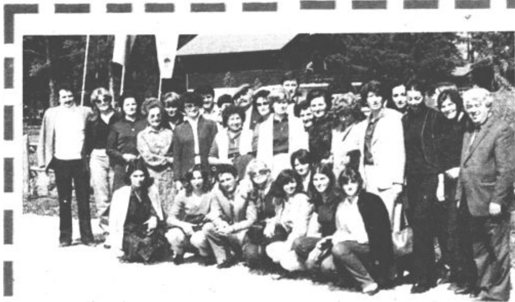
Gostje in gostitelji pred Savinjskim gajem

Društvo je v obdobju od zadnjega občnega zbora organiziralo 10