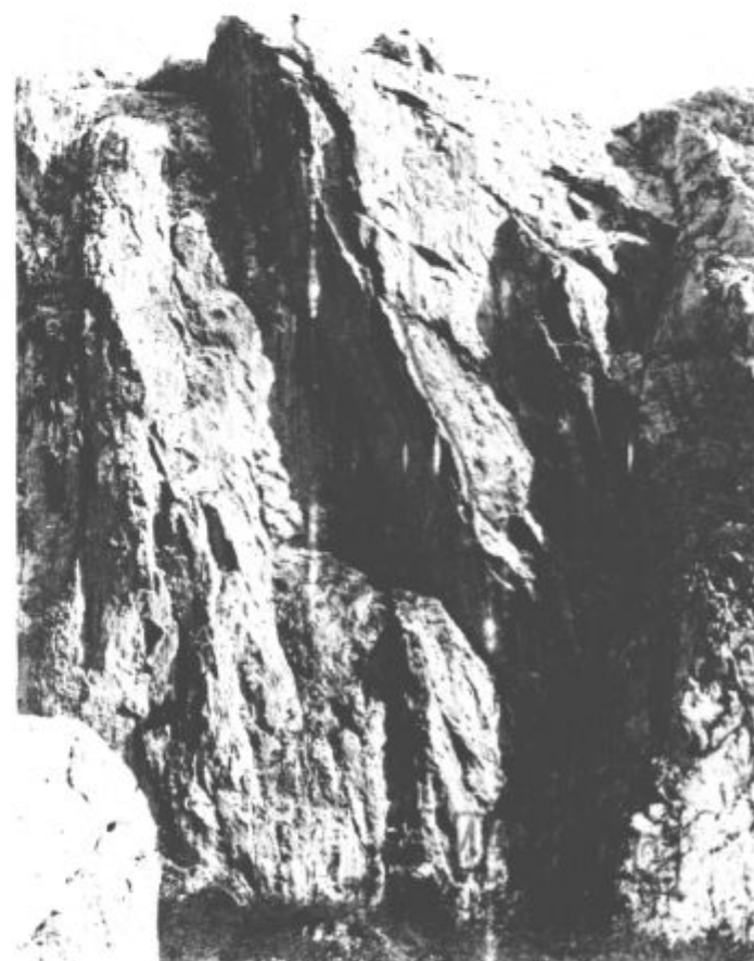
Stena Aniča Kuka z vrisanimi smerema pod 1. BRID KLINA (VI A3, A4, E), in pod 2. MOSORAŠKA (IV +, V).