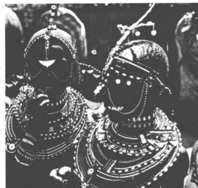
Deklici plemena Masai