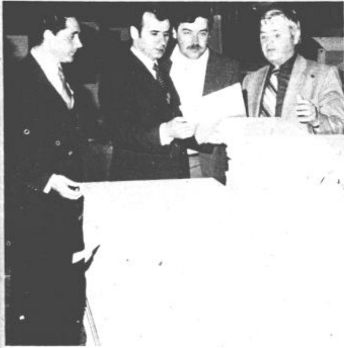
Miran Potrč si je z zanimanjem ogledal delovne prostore nazarske lesne industrije