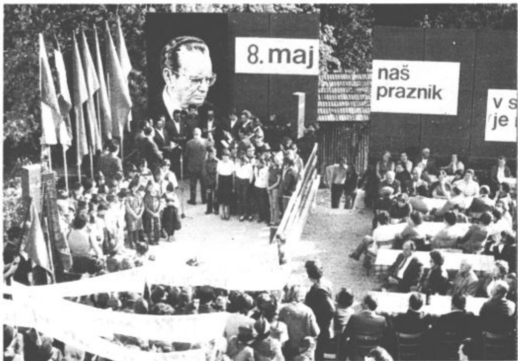
Osrednja slovesnost je bila v Skornem