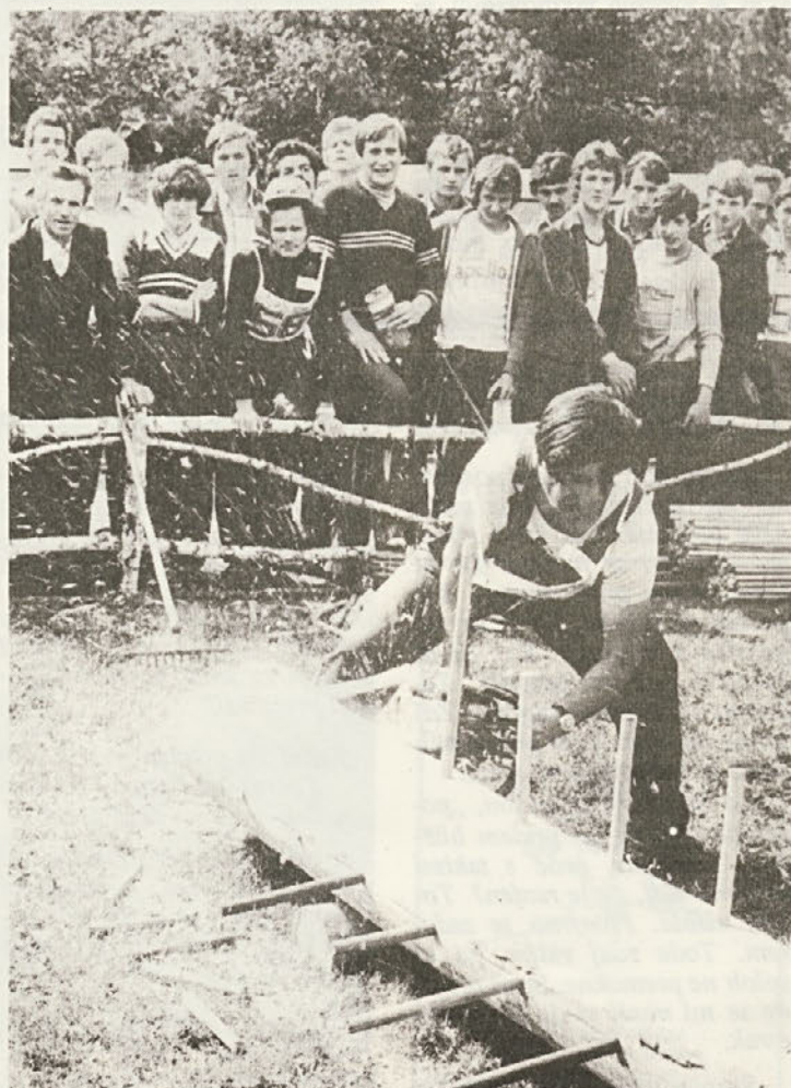
Na Loki je množica Novomeščanov z zanimanjem sledila napetemu tekmovanju v gozdarskih spretnostih.