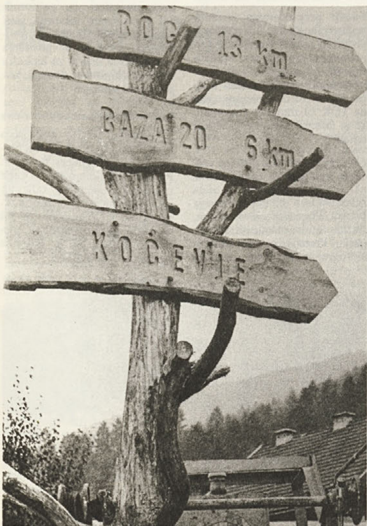
Naš prispevek k ureditvi ozje in širše okolice Baze 20, neminljivega spomenika revolucije: potokazi iz lesa, kot ga premorejo naši bogati gozdovi...