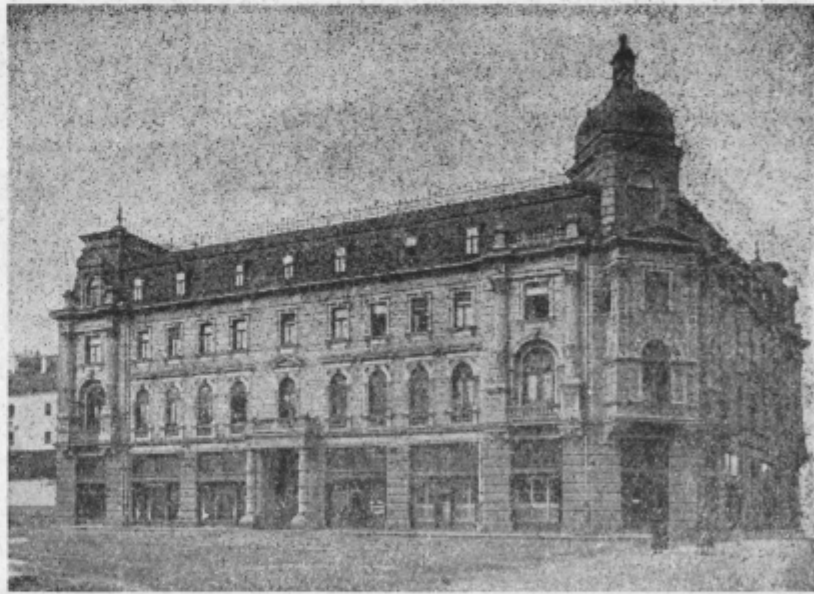
V NARODNEM DOMU JE BILA 14. MARCA 1897 PRVA OPERNA PREDSTAVA V CELJU. IZVAJALI SO VERDIJEVO: RIGOLETTO

»Prodana nevesta« se je od njenega krsta v mariborskem gledališču vedno znova vračala v mariborski repertoar. Vračala se je kot slavnostna predstava in vračala se je k otvoritvam počdnih