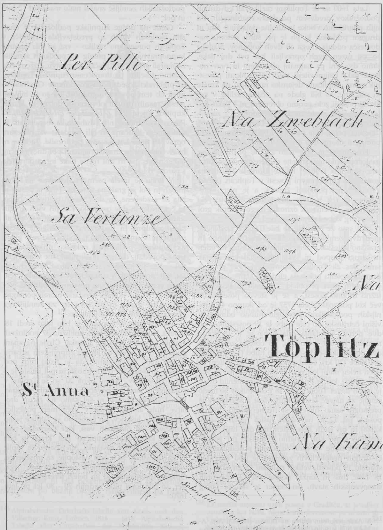
Toplice po franciscejski katastrski mapi leta 1825.