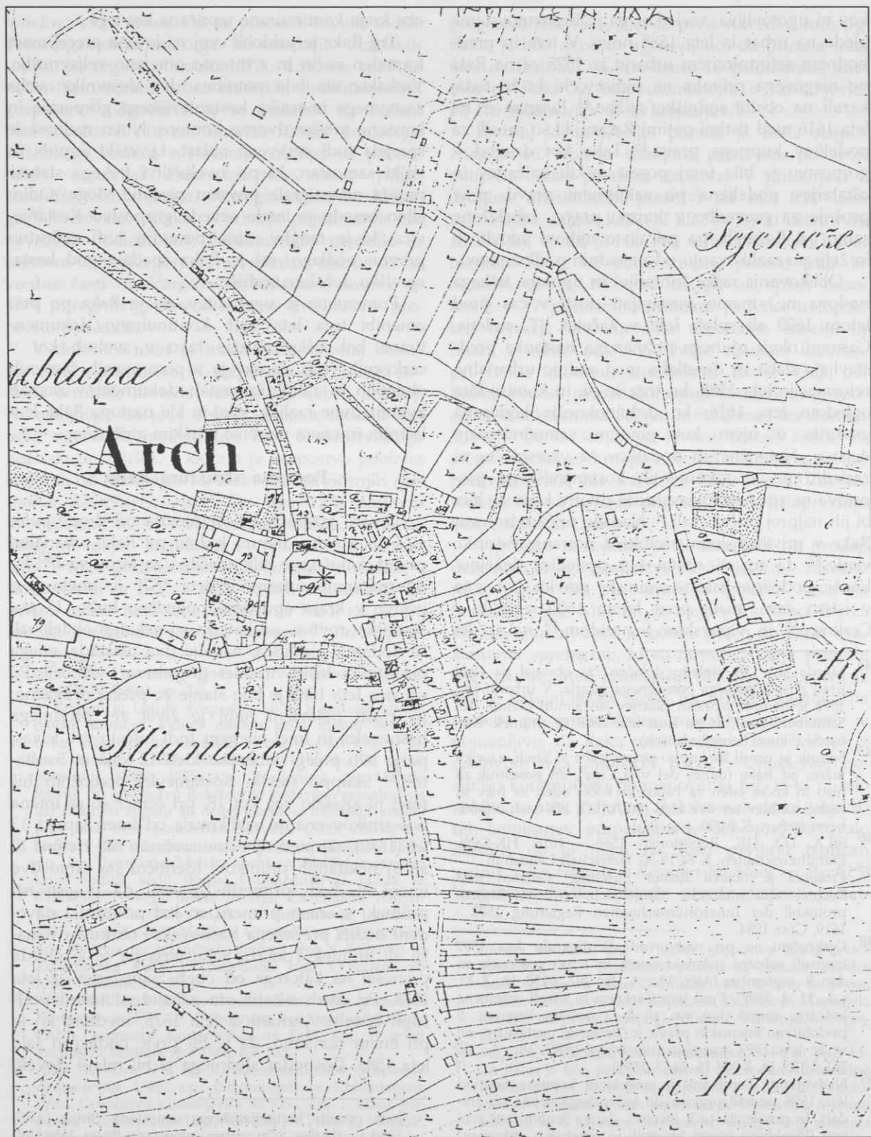
Raka po franciscejski katastrski mapi leta 1825.