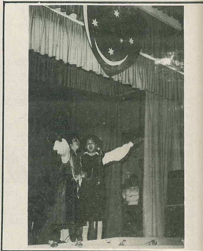
Na kulturni prireditvi v St. Brigit Hall