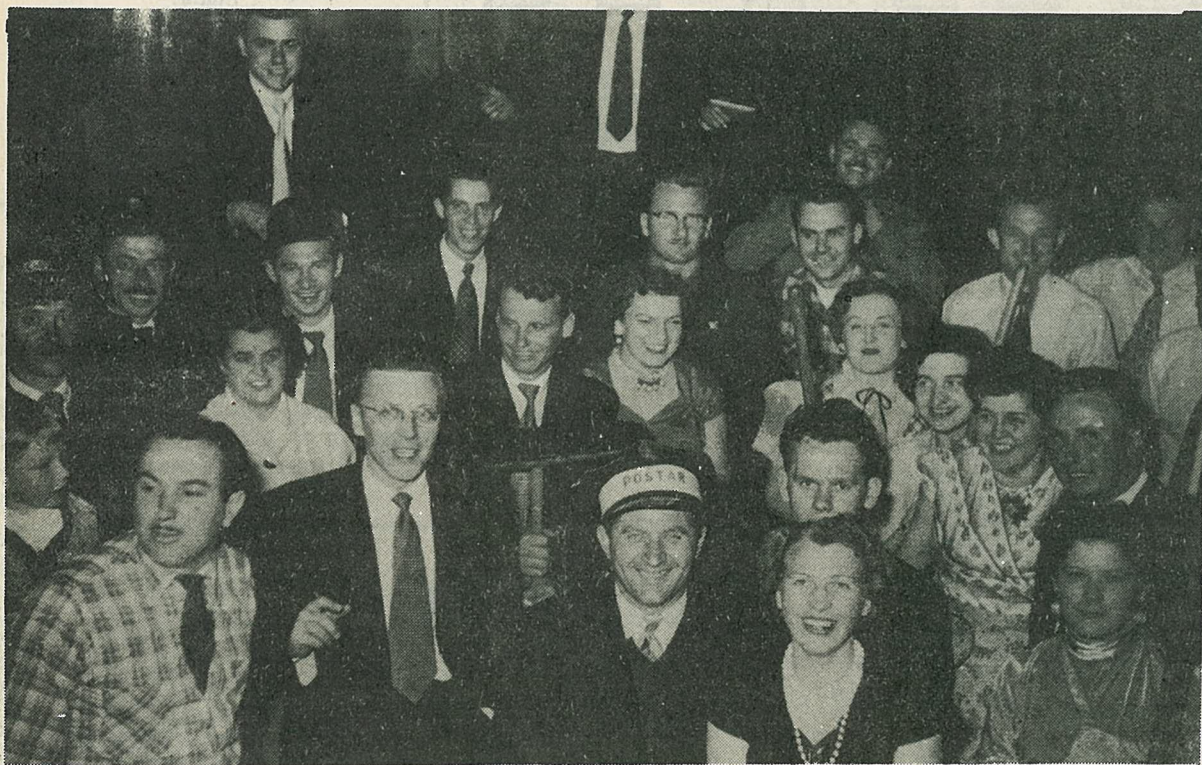
Po veseli zabavi v Prahanu

Aj, še poznate mlade obraze — morali bi jih, saj večina je še na naši strani.