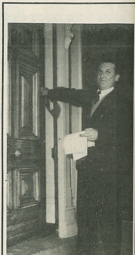
Ob otvoritvi prvega slovenskega Doma v Melbourne

Za izdelavo enciklopedije so se aktivirale tako znanstvene kot materialne moči vseh jugoslovanskih narodov. Mar bi bilo res tako trošenje, ko bi se poglobitveno opravljeno delo diferenciralo še s prevodi in priredbami? Ne! Takih stroškov ne smemo gledati kot izgubo. To je pravica delovnih ljudi naše domovine! Znanje je moč, znanje je pogoj napredka — vendar znanja ne dele samo šole, znanje mora biti dostopno vsakomur tudi po takih oblikah, kot so enciklopedije. Če vemo, da je znanje edina resnična gonilna moč rasti zavesti, se bomo spraševali, kje dobiti dinar več za poslovenjenje, pomakedonjenje Enciklopedije Jugoslavije?