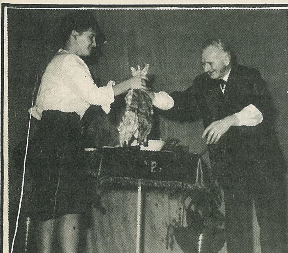
Naš poznani čarovnik