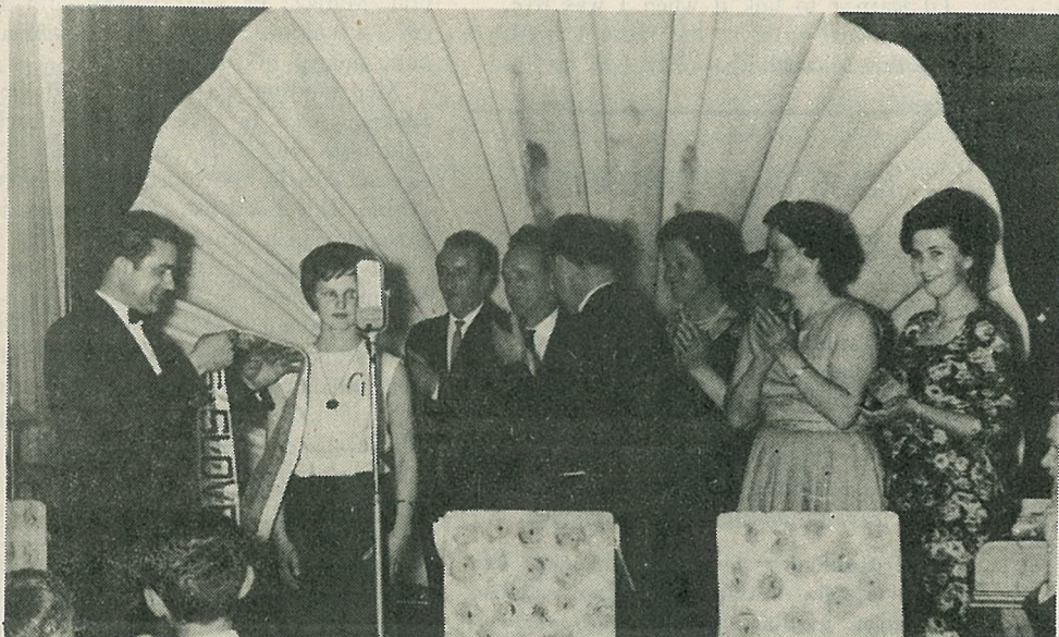
Nagrada slovenski lepotici

— Uspela sva, draga moja. Vse imava, kar sva potrebovala. Vse se je lepo izteklo. Le škoda, da nisem ustanovil še nekaj tozdov, da bi bila zbirka daril še malo večja.