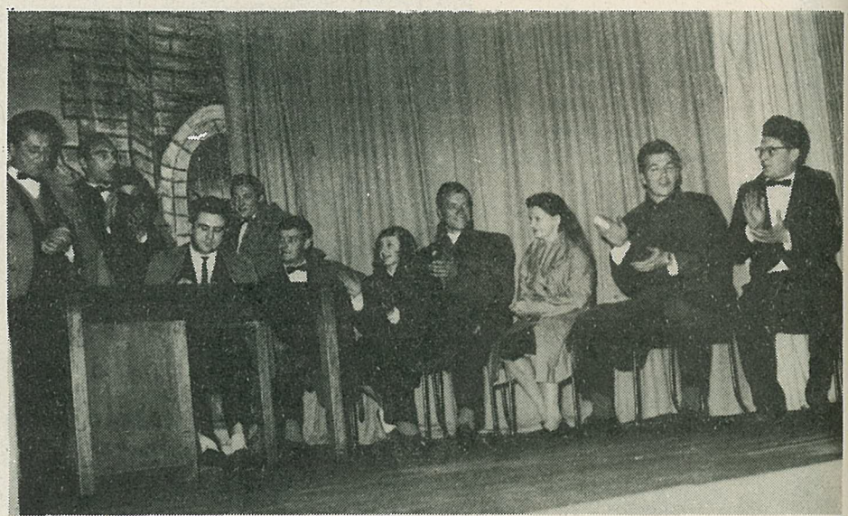
Priznanje po prireditvi