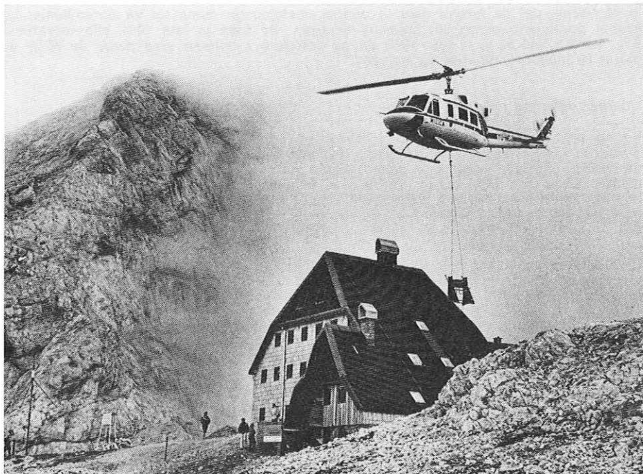
Sodoben pomočnik pri gradnji — helikopter