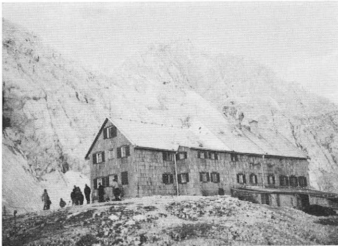
Triglavski dom na Kredarici — 2515 m — pred obnovo