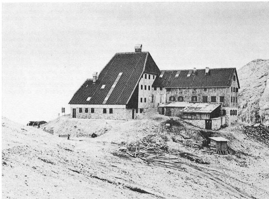
Faza gradnje Triglavskega doma na Kredarici 1982 (jugozahod)