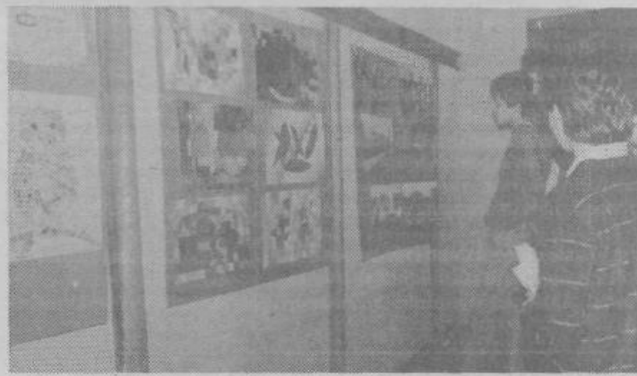
Na začetku Tedna mladih Moščanov so v zgornjih prostorih KD Španski borci odprli tudi razstavo izdelkov učencev osnovnih šol naše občine

Hura! Vzdignjene roke in vzkliki veselja. Tekmovalci iz OS II. grupe odredov so pravilno uganili naslov popevke. Ekipama pred njima se to ni posrečilo. Poznavanje glasbe — ne le zabavne, marveč tudi klasične — je bila namreč poleg slovenskega jezika, matematike, fizike, biologije, kemije in zgodovine tema, v kateri so se preizkusili učenci štirih osnovnih šol iz naše občine na kvizu, ki je bil ena izmed številnih prireditev v okviru Tedna mladih Moščanov.