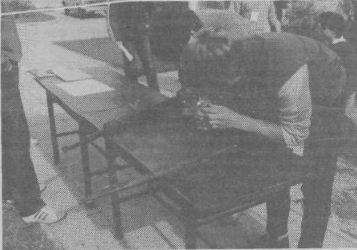
Srednješolci razstavljajo in sestavljajo puško M-48