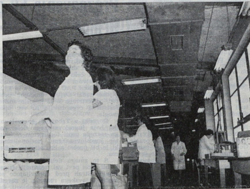
Delavke iz oddelka filtrov