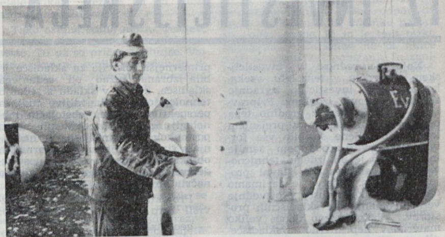
Koncentracija pri delu