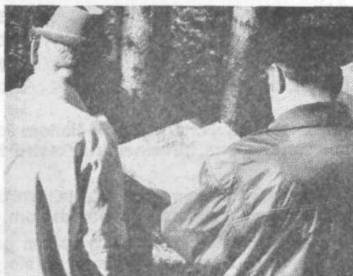
Pri reševanju topografske naloge

Uspeh v reševanju taktične naloge je bil v celoti relativno dober. Pri vseh starešinah se je poznalo, da so bili preveč sigurni v material, ki se je na seminarju posredoval. Ta »vodilni«, več let trajajoči sistem bo treba spremeniti, da bi bili rezervni starešine bolj samostojni pri rešitvah svojih nalog. Tudi povezava naloge »na pravi teren« bi imela več uspeha.