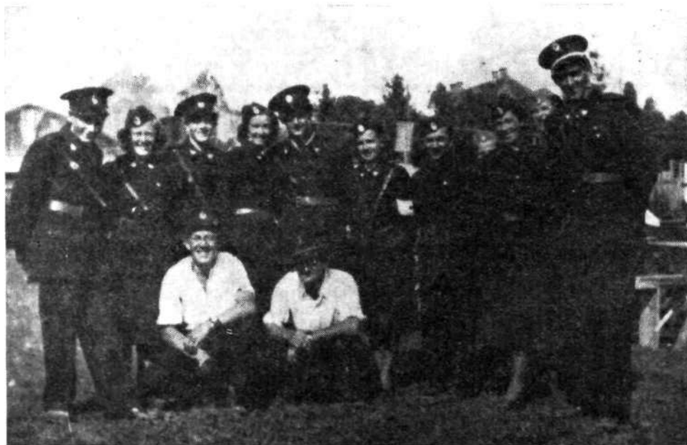
Skupina članov in članic PGD Zelezniki na gasilskem festivalu v Kranju

Da bi v društvih dosegli boljšo orga- niziranost in večjo akcijsko sposobnost, je bila leta 1954 pri okrajni GZ Kranj formirana gasilska brigada, v katero je bil vključen tudi gasilski odred Zelez- niki, ki je združeval društva: Rudno, Za- li Log in Zelezniki.