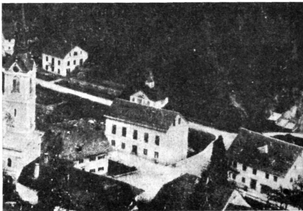
Del trga na Trnjam, za bivšim Prosvetnim domom, ob cesti na Racovnik, stari gasilski dom, okrog leta 1928