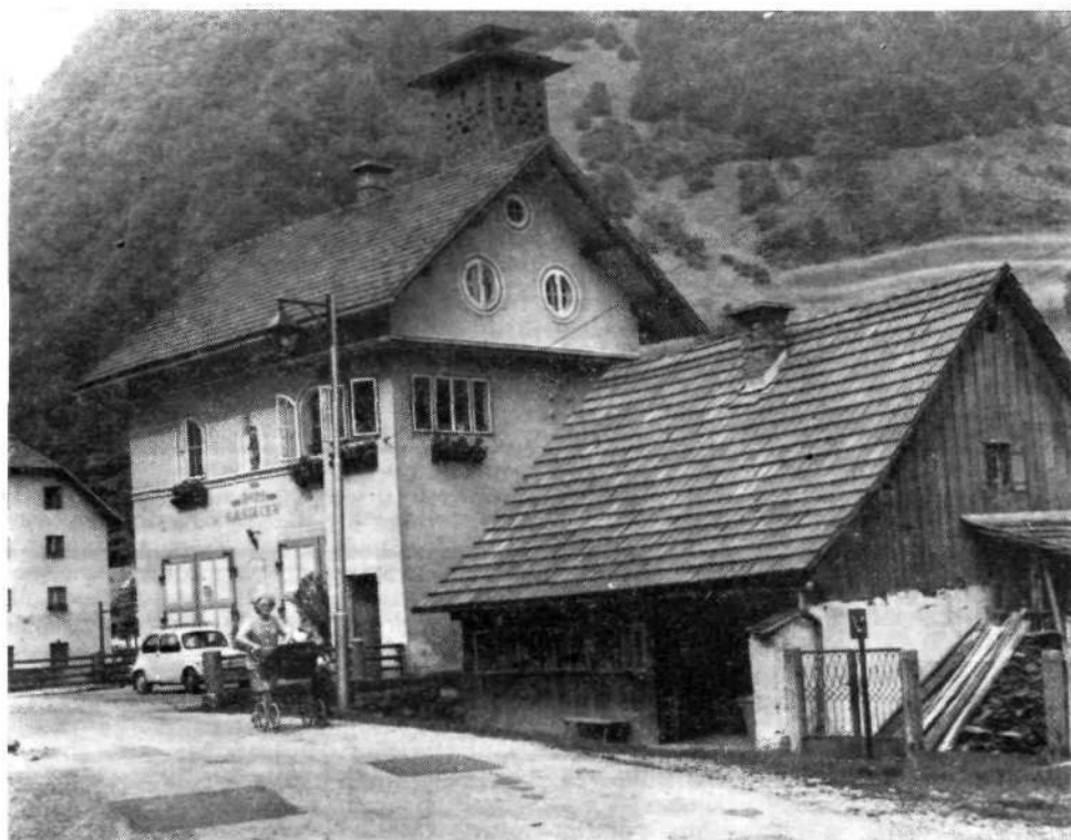
Sedanji gasilski dom v Železnikih, ob njem Morajna