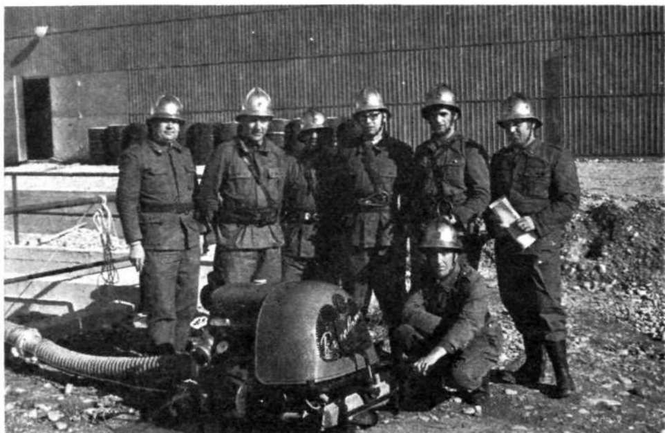
Ekipa GD Zelezniki na vaji v LTH Škofja Loka oktobra 1971

jo je še mnogo let koristno uporabljal. Kupil jo je za 3800 din. Seveda so si gasilci še pred prvo svetovno vojno nabavili več delovnih oblek in tudi nekaj paradnih uniform.