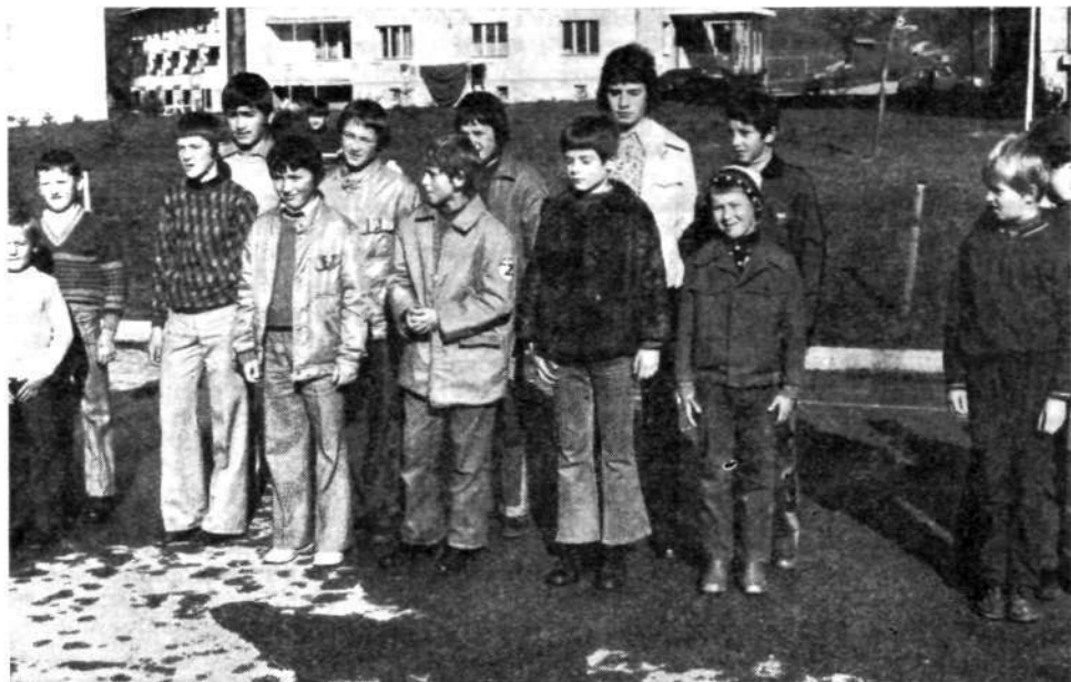
Pionirska gasilska skupina iz Zeleznikov na občinskem tekmovanju v Skofji Loki 3. novembra 1974