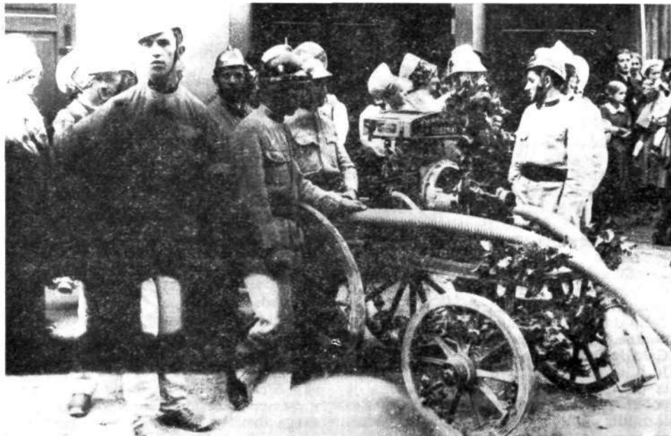
Slovesnost pred novim gasilskim domom 10. julija 1938, ko so predstavili novo motorno brizgalno