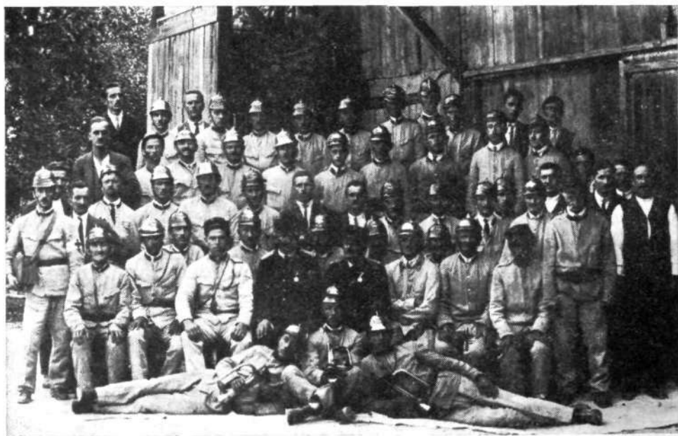
Skupna vaja PGD Železniki, Rudno in Selca na Studenem 14. avgusta 1927

Društvo je leta 1941 imelo naslednjo imovino in opremo: