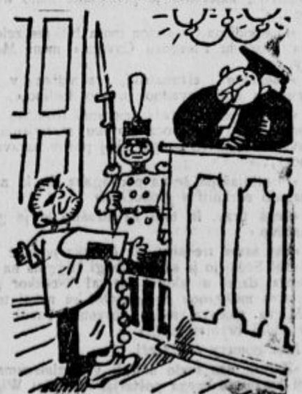
»Da, priznam, da sem bil že kaznovan zaradi vloma, tatvine vlačugarstva, poneverb in krive prispege; toda povejte mi človeka, ki bi bil brez napak?«