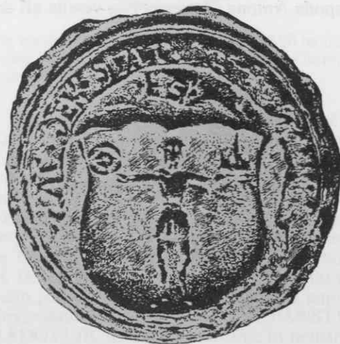
Pečat Radovljice iz začetka 16. stoletja na listini z dne 24.IV. 1583 v Arhivu Slovenije, premer 34 mm, risal avtor

»Govoreči« grb Radovljice iz 1514. je posebnost tudi zaradi vsebine pečatnega napisa S: DER STAT RADMANSTAT. Iz napisa je