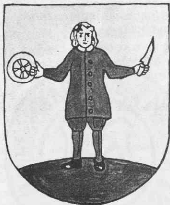
Grb Radovljice iz albuma E. Laszowskega Grbovi Jugoslavije, ki je leta 1930 izšel v Zagrebu, risal avtor

radovljiškem grbu postavil v levico zlat lemež. Kolo v desnici je bilo najbrž vzrok, da je Laszowski mislil, da gre pri možu iz radovljiškega grba za kmeta. 17