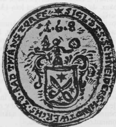
Pečatnik ceha radovljiških krojačev iz leta 1680 v Narodnem muzeju, premer 24 x 26 mm, medenina in železo, risal avtor