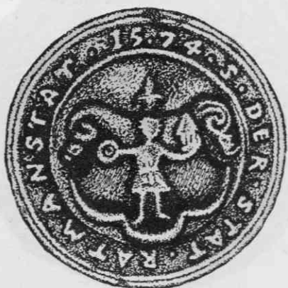
Pečat Radovljice iz leta 1574 na listini z dne 15.X. 1707 v Arhivu Slovenije, premer 27 mm, risal avtor

»Govoreči« grb mesta Radovljice, oziroma njegov glavni del, se je ohranil tudi na pečatu radovljiških krojačev iz leta 1680. Nad cehovskim grbom je bil upodobljen stoječ mož, ki drži v levici kolo, v desnici stolp. 11 Ohranjen je tudi pečatnik za ta pečat. Slikar Jernej Ramschüssl je v letih 1687 in 1688 v gvaš tehniki naslikal 2023 grbov za heraldični zbornik Janeza Vajkarda Valvasorja Opus Insignium Armorumque. V tej knjigi kranjskih grbov je radovljiški mestni grb ščit, sestavljen iz belega polja, v katerem stoji na zeleni podlagi mož,