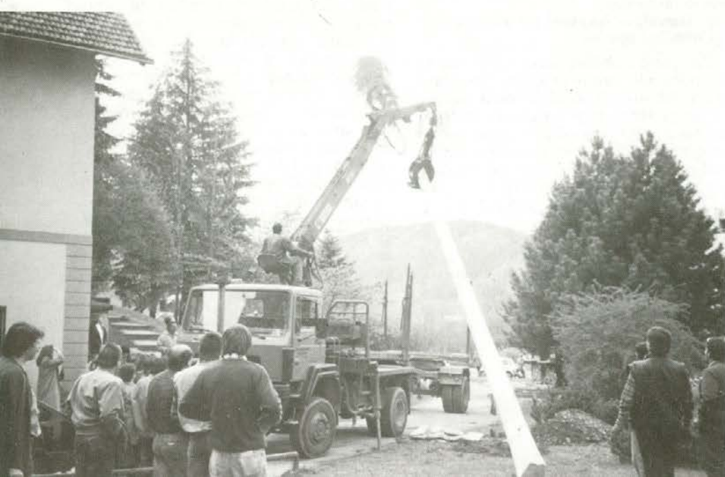
Slovenjegraški gozdarji postavljajo mlaj.