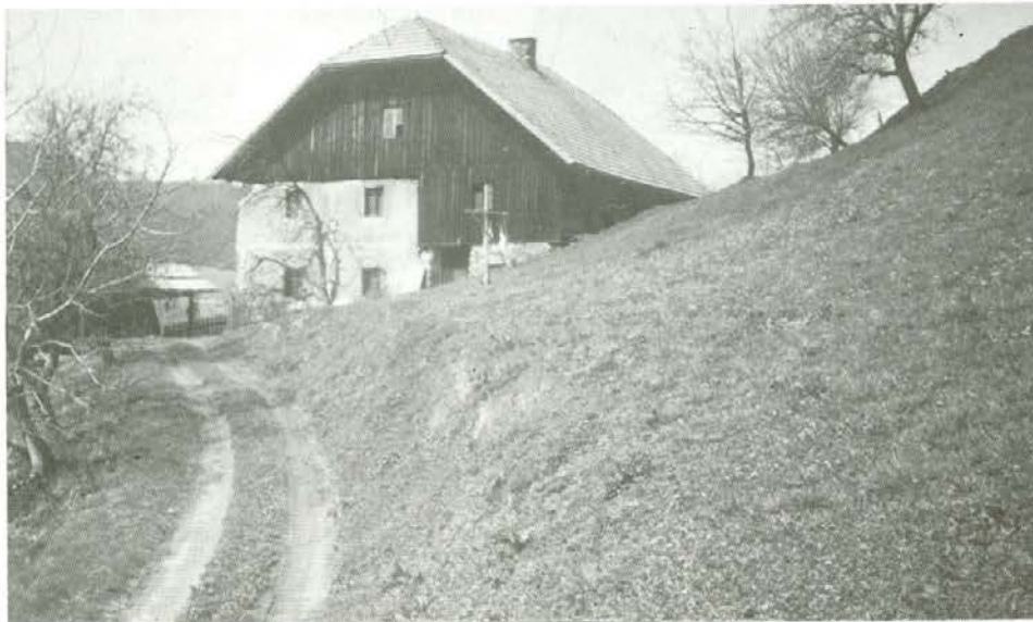
Stara hiša in kašta na Pistoti v Razboru sta 10. marca 1953 do tal pogoreli