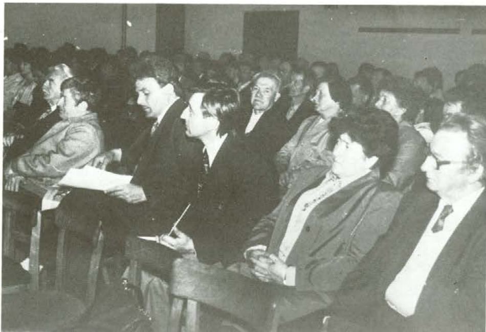
Člani in gostje na občnem zboru