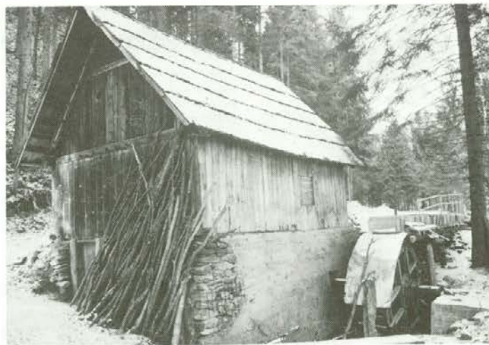
Kolesa Lipnikovega mlina se le občasno zavrtijo. Kolo je zavarovano pred izsušitvijo in drugimi vremenskimi vplivi.