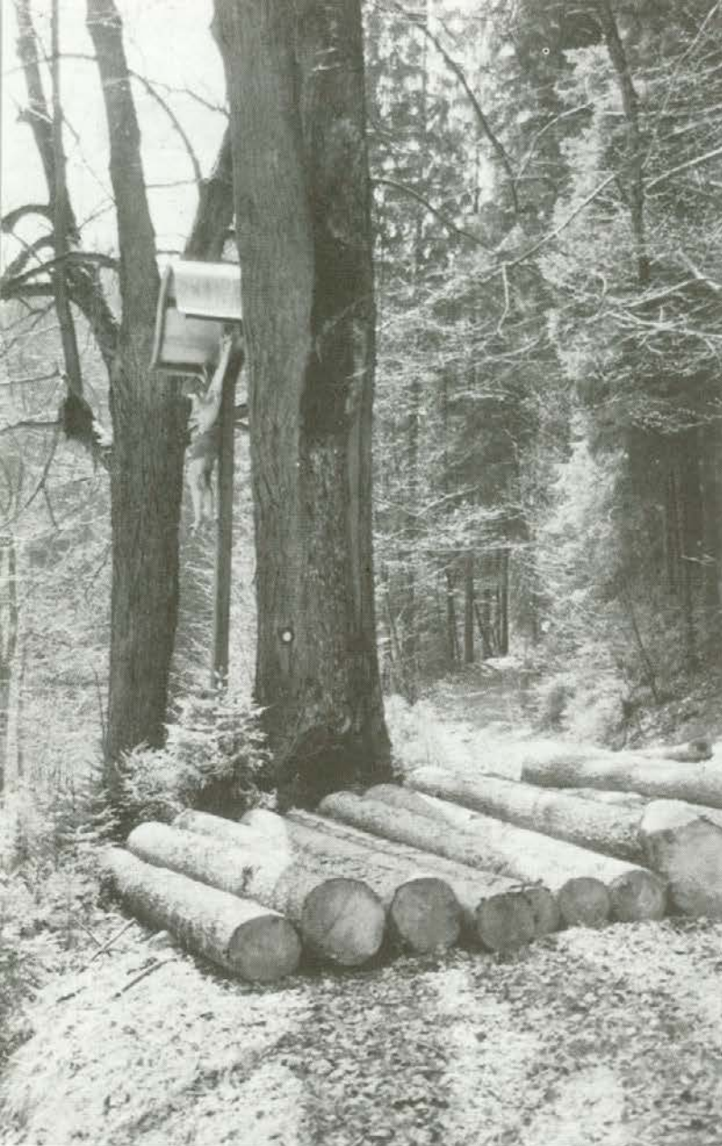
Hlodi ob križu