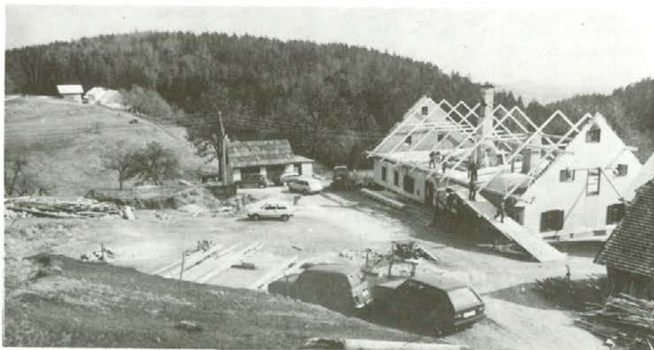
Pri Momovih so tiste dni, ko smo bili pri njih, popravljali ostrešje stanovanjske hiše, potem pa je na vrsti gradnja novega gospodarskega poslopja