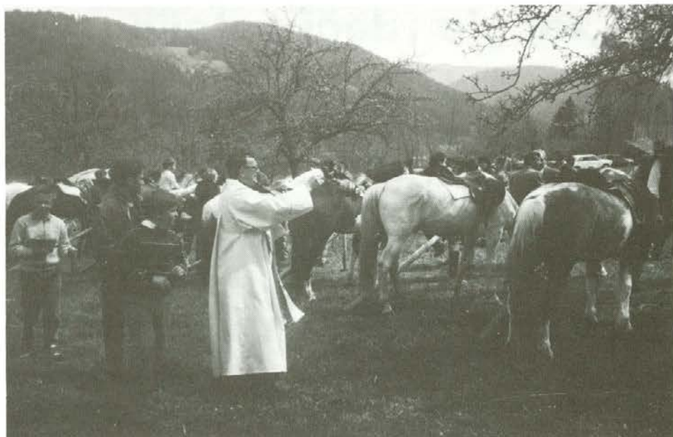
Žegnanje konj na Legnu