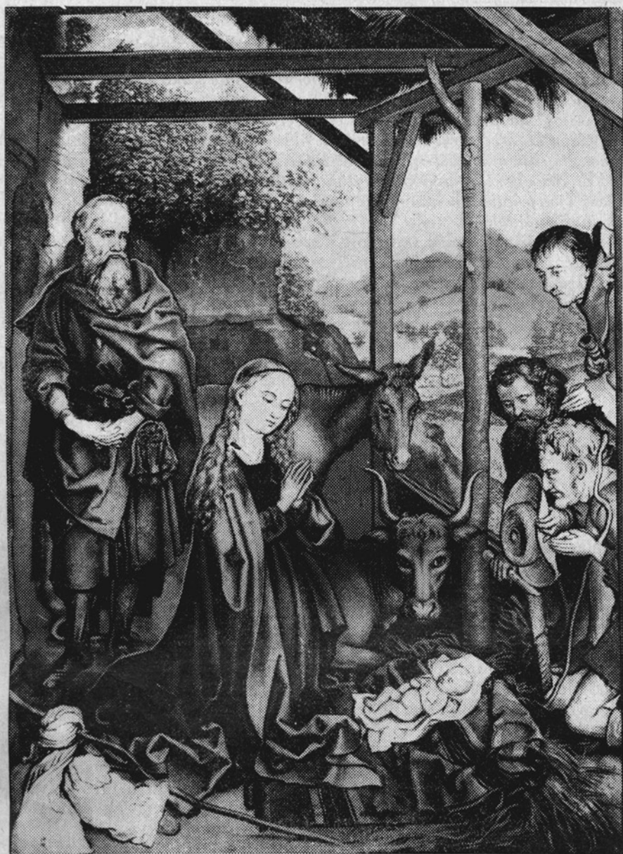
M. Schongauer: Pastirci molijo Jezusa.