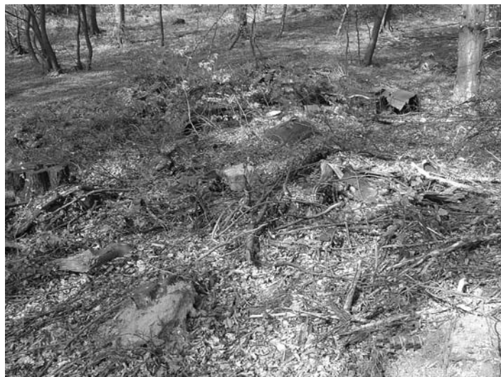
Zgornji Velovlek 2008

Podžupan Občine Destrnik: Branko ZELENKO