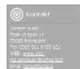
Vzorec brezplačne spletne strani za društva