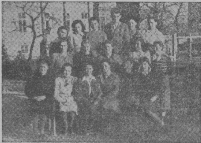
Internatski tečajniki Rdečega križa

Letošnja Novoletna jelka bo nekaj novega za naše najmlajše, obenem pa bodo dali pionirsko zaoblubo, da se bodo v novem letu prav tako vztrajno in vestno učili, kakor delajo njihovi starši pri strojih v tovarnah, na polju in drugod. Tudi oni bodo postali udarniki dela-učnja.