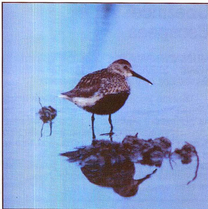
DUPLAR Columba oenas STOCK DOVE - 2-15 in May and June 1996 in the vicinity of Ljubljana

Z golobom duplarjem Columba oenas sem se prvič srečal 21. maja 1996 ob Želimeljščici blizu zaselka Kremenica. Takrat sem opazoval tri ptice, ki so nemirno letale zdaj v eno, zdaj v drugo smer nad tem delom Barja. 29., 30. in 31. maja sem videl po enega ali dva goloba duplarja na poljih med šmartinsko cesto in vojašnico Polje. Bili so zelo plašni in so vsakokrat odleteli, še preden sem se jim približal na 100 m. Najlepše opazovanje pa se mi je na istem kraju ponudilo 27. junija 1996.