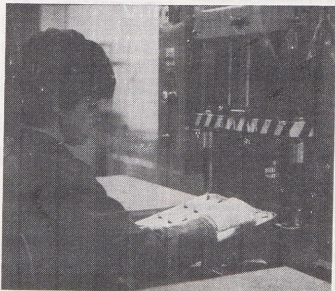
M.L. Poskusna proizvodnja perlanih grelcev v TTE