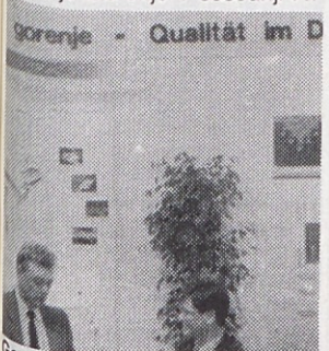
Geslo letošnjega nastopa "Gorenje – Kakovost v detaljih" so razstavljene kuhinje samo potrjevale!

S proizvodnjo kuhinjskega pohištva je Gorenje v sosednji Av-