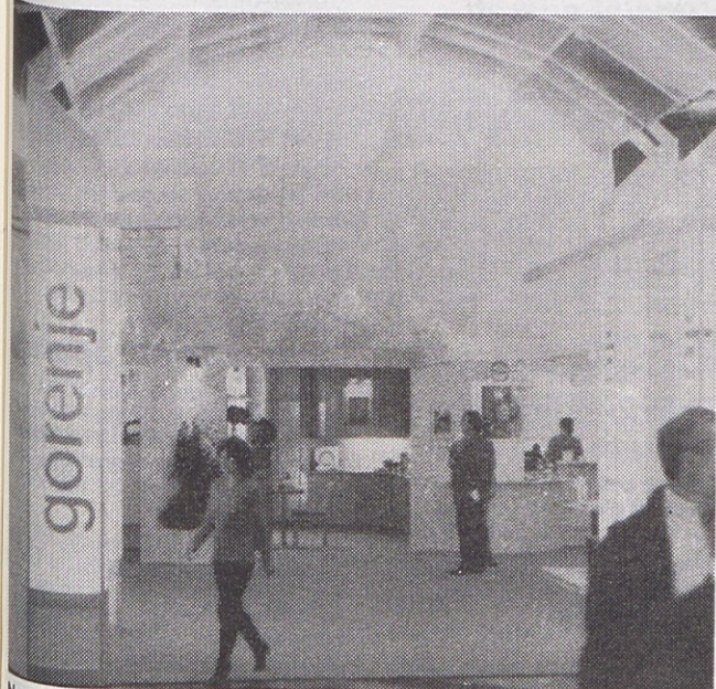
Nastop na 7. avstrijskem strokovnem sejmu pohištva v Salzburgu je samo dokaz več, da Gorenjeva tovarna pohištva iz Freistadta stopa v štric z drugimi avstrijskimi proizvajalci kuhinjskega pohištva