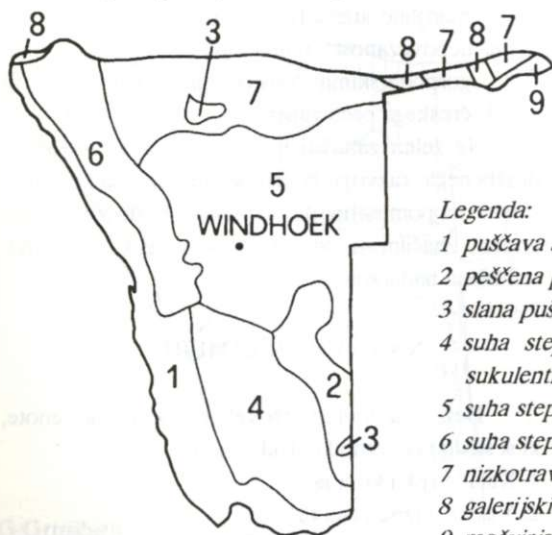
Slika 2: Tipi vegetacije v Namibiji

3. Obalni pas zavzema od reke Kunene na severu do Port Nollotha v JAR 1500 km dolga in 50 - 130 km široka puščava Namib, ki je v pretežnem delu prava peščena ali skalnata puščava z neznatnimi množinami padavin (Lüderitz 17 mm). Puščava je nastala zaradi hladnega Benguelskega toka, ki teče vzdolž obale od juga proti severu in prinaša puščavi samo pogoste megle. V južnem delu puščave okrog Lüderitza in ustja reke Oranje so