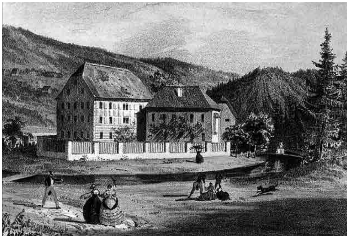
Dvorec Dobrnica, tretji dom Valvasorjevih dobrnskih potomcev, okoli leta 1840 po Novi Kaiserjevi suiti (po: Stopar, Grajske stavbe, str. 37).

na pridobitev dvorca Dobrnica dve leti zatem, leta 1866, je torej zanj pomenila nekakšno nadomestilo za izgubljeno Dobrno, a ne za dolgo. Že leta 1870 je Resingen obe zemljiškoknjžno ločeni dobrniški posesti prodal upokojenemu nadporočniku Prokopu von Zeidlerju. Ta je kupnino 27.500 goldinarjev, od tega 2.500 za premičnine, poravnal v celoti in takoj prevzel posest. Pri tem mu je bilo prepuščeno, ali bo podaljšal več zakupnih pogodb, ki jih je z zakupniki sklenil Resingen. 155 Razlogov za prodajo ne poznamo, gotovo je le, da posredi ni bila zadolženost, saj deželna deska ne kaže nobenih novih hipotek. 156 Ko se je ostareli vitez poslavljaj od svoje zadnje graščinske posesti, je minilo natanko sto let, odkar je njegov ded in Valvasorjev pravnuk Avguštin baron Diener-sperg leta 1770 postal dobrnski graščak.