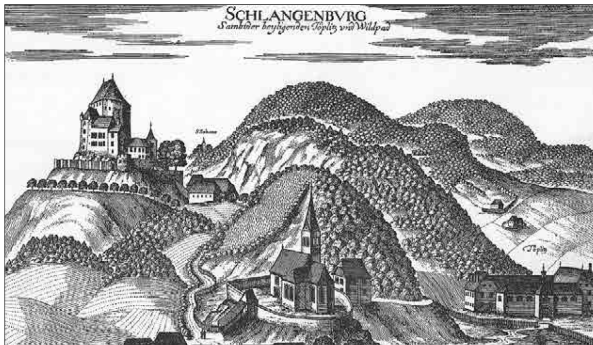
Dobrna s starim gradom Schlangenburgom in toplicami po Vischerjevi Topografiji iz leta 1681 (Vischer, Topographia Ducatus Stiriae, sl. 105).

Dienerspergove neveste, se je na Dobrno priženil leta 1697, in sicer k dedinji iz rodbine Gačnikov. Ti so grad s toplicami kupili že leta 1613 in pol stoletja pozneje, leta 1666, pridobili plemiški naslov pl. Schlangenberg. 14