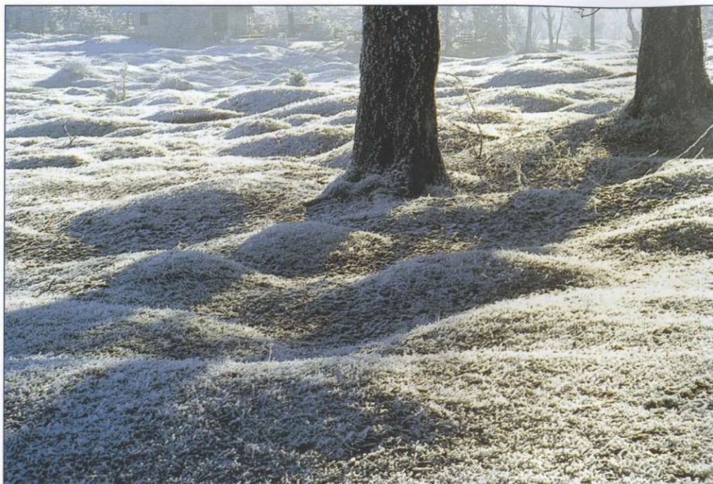
Slika 1: Grbinasti travnik.

V zadnjih desetletjih živi v domačijah Zgornje Radovne, raztresenih po trikotno razširjenem severozahodnem delu doline, okrog 60 prebivalcev. Vas od Srednje Radovne loči ožina med Mežaklo (Jerebikovec, 1593 m) in hribom Kuhinja. Po ponovni zožitvi doline pri Debelem kamnu pridemo v Spodnjo Radovno, nekdanj imenovano Fužine. Srednja in Spodnja Radovna sestavljata razpotegnjeno naselje Radovna. Število Radovničanov močno upada; leta 1991 jih je bilo le še 17. Domačini se ukvarjajo predvsem z živinorejo in gozdarstvom, nekateri pa odhajajo na delo v bližnja središča. Od nekdanjega samooskrbnega poljedelstva se je ohranilo le gojenje krompirja. Ustavilo se je tudi več mlinov in žag.