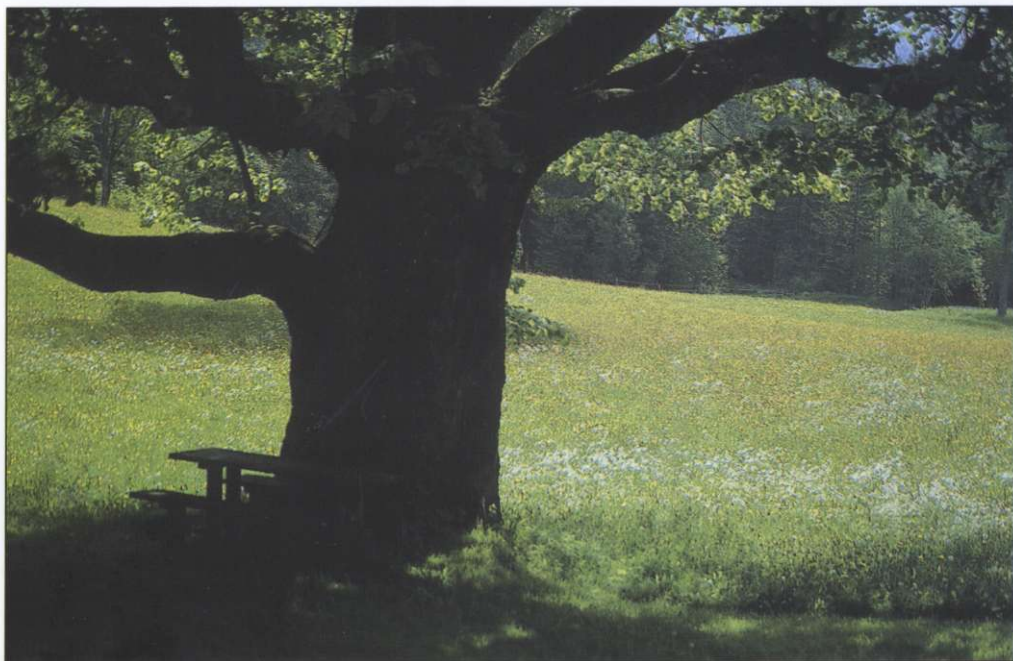
Slika 2: Deblo Gogalovega lipovca.

V Poključki soteski najdemo nekatere kraške oblike, na primer naravne mostove in votline. Ena najbolj znanih je Poključka luknja, krajši prehodni jamski rov pod severnim robom soteske. Pot skozi votlino je od nekdanj omoččala zložen prehod na zgornji rob soteske in naprej na ravnejši svet Stare Pokljuke. Morda je prav pomembnost tega prehoda povzročila, da še danes marsikdo pomotoma uporabi ime Poključke luknje kar za poimenovanje celotne soteske.