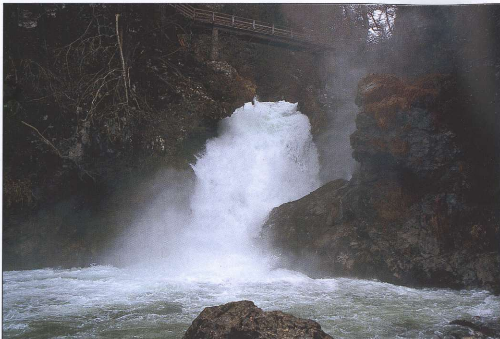
Slika 3: Slap Šum na reki Radovni je eden redkih slovenskih rečnih slapov.

Poključka soteska je tudi botanično in geološko zanimiva. Skoznje so speljali Slovensko geološko pot, ki se pričinja na Jezerskem, prečka Triglavski narodni park in se nadaljuje v osrednjo Slovenijo.