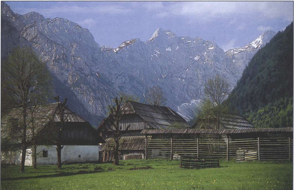
Slika 4: Pocarjeva domačija v Zgornji Radovni.

Gospodarsko poslopje je nadstropna, delno zidana in delno lesena stavba. V pritličju najdemo štiri med seboj ločene prostore: goveji, ovčji in kozji hlev ter listnjak. Vhode imajo z dvoriščne strani. V nadstropju je dvoje prostorov: »pod« za mlatenje ali otepanje žita in senik.