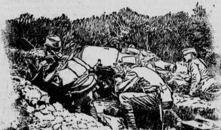
Oddelek avstrijskih strojnih pušk.

Če glava boli in ni spanja, nasvetujejo ta-le zanesljivi pomoček: Preden greš k počitku, vzemi nekoliko okvašenega testa od domače moke (za črni kruh) ter namaži