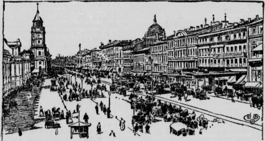
Revolucija v Petrogradu. — Nevski prospekt.

Kriza na španskem. Vlada v Madridu je podala ostavko.