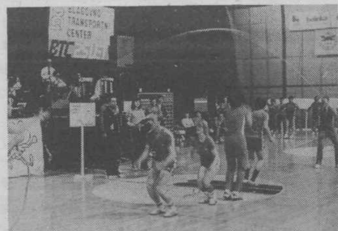
Ena od disciplin je bila tudi skakanje čez vrvi.