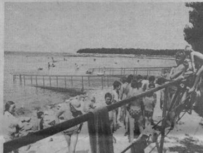
Lega je idealna, saj imajo do morja le nekaj deset metrov. Plaža pa je taka, da so z njo zadovoljni tudi neplavalci, ki se sprva še boje pregloboke vode. Letovanja ob morju mladi Bežigradčani najbrž ne bi zamenjali za letovanje na celini, zato je treba omogočiti tudi tistim, ki so letos zaradi pomanjkanja prostora ostali doma, da se naučijo lepote naše morja.

»Gospodarjenje je slabo, denarja je dovolj le za organizacijo letovanj in honorar osebju, kaj več pa ne zmoremo,« so potožili. Čeprav so odgovorne interesne skupnosti iz svojih programov skoraj povsem črtale letovanja, pri Zvezi prijateljev mladine kljub temu razmišljajo o morebitni razširitvi. Možnosti je več: najbrž bo najbolj realna tista, po kateri bi uredili na travniku pred domom provizorij z okrog 80 posteljami; kuhinjo bi povečali tako, da bi podrli vmesno steno z