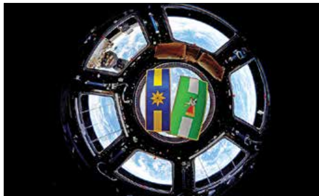
Randy Bresnik je bil lani na misiji na mednarodni vesoljski postaji, kamor je s seboj vzel tudi zastavi Ljubnega in Luč.

V Zgornji Savinjski dolini bo Randy Bresnik v nedeljo, 11. marca. Po obisku Ljubnega ob Savinji,