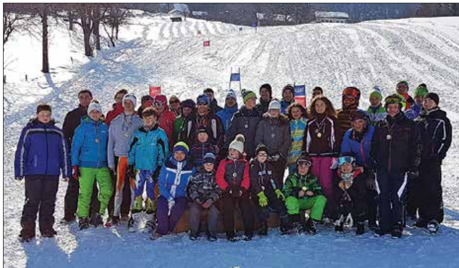
Nedeljsko tekmovanje je pospremlilo odlično vreme za smuko.