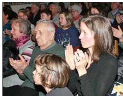
Navdušeno občinstvo je pevce nagrajevalo z dolgimi aplavzi.

Poleg lepe slovenske in dalmatinske pesmi je bilo slišati še dela v angleščini, latinščini, rušči-