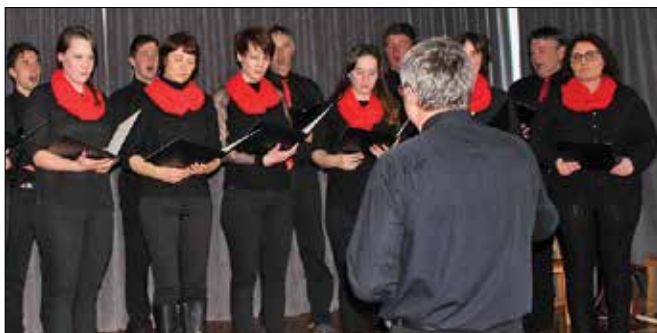
Mešani pevski zbor Šmihel je zapel pesmi Dober večer, Vuštnjša ja ni ter Slovenija, od kod lepote tvoje.