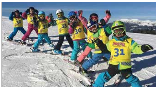
Na otrokom prijazen način so jih vodili do tega, da so vsi usvojili osnovne prvine smučanja.

Skoki igro in z uporabo različnih motivacijskih iger so bili prvi smučarski koraki otrok povezani z veseljem in navdušenjem. Na otrokom