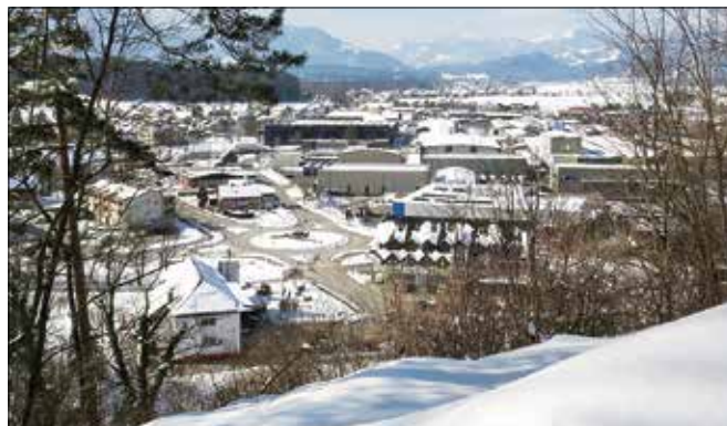
Na območju Zgornje Savinjske doline je najbolj razvita občina Nazarje, ki se med 33. občinami Savinjske regije nahaja na visokem 6. mestu.

Kot že omenjeno, je od višine koeficienta razvitosti občin odvisen obseg sofinanciranja investicij iz državnega proračuna. Ker občini Solčava in Luče ne dosegata koeficienta v višini 0,90, bo v letošnjem in prihodnjem letu obseg sofinanciranja njihovih investicij iz državnega proračuna znašal 100 odstotkov. Občini Gornji Grad in Rečica sta po razvitosti blizu slovenskega povprečja,