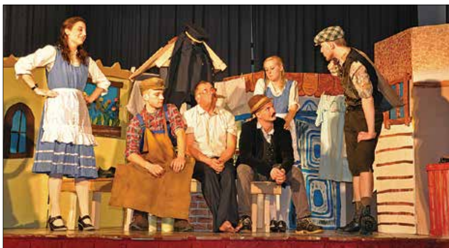
V komediji se prepleta zgodba bogatega trgovca, revnega čevljarja, policaja s hčerkama Antonijo in Zefko ter kramarja Hodla, ki s svojimi zvijačami poskrbi, da je na koncu vse tako kot mora biti.

Na odru se prepleta zgodba bogatega trgovca Dinarjevega Zlatka, revnega čevljarja Lojza, policaja Joca, njegovih hčerk Antonije in Zefke ter kramarja Hodla de bodla. Trgovec Dinarjev je vedno zaposlen in nima časa niti za ljubljeno dekle, revni čevljar Lojz ne ve, kako osvojiti svojo izvoljenko, saj nima ničesar razen čevljev. Policaj in oče dveh za ženitev godnih hčera