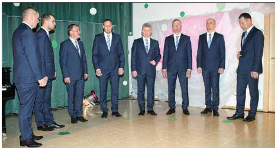
Pesem Potrkan ples je Oktet Žetev zapel kot zaključno točko svojega nastopa.