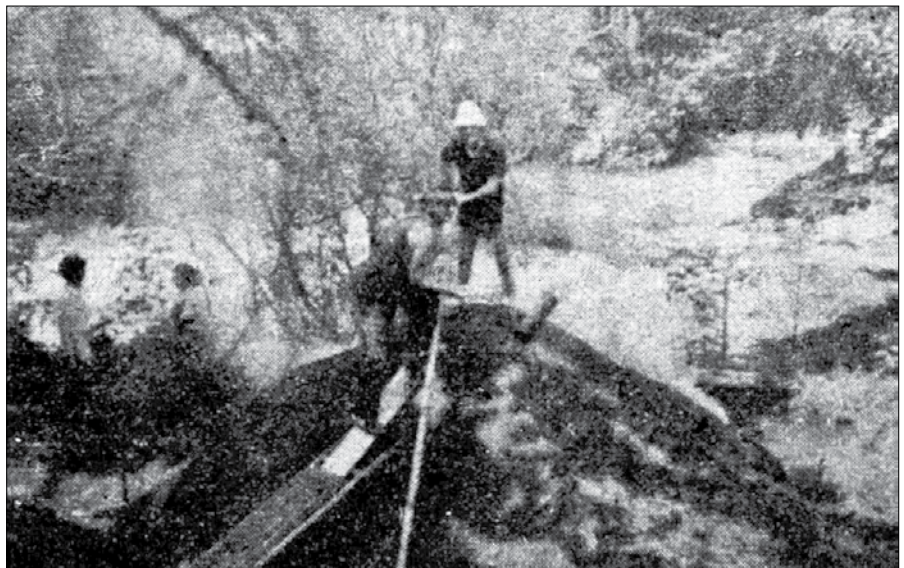
Med kuhanjem oglja

Ko se prične iz odprtini na kopi kaditi sivo, je znak, da je oglje kuhano, prej se namreč kadi belo. Spravilo kuhanega oglja ni lahko delo. Tre- ba je namreč v spodnjem delu kopo odkopati in s posebnim orodjem izveči iz nje oglje. Tega je treba nato pustiti, da se ohladi, pri tem pa je dobro imeti pri roki vodo, saj se rado zgodi, da prične oglje na zraku goreti. Takšno spravilo tra- ja dva do tri dni in zahteva pazljivost. Iz opisa- ne kope se lahko pričakuje kakih 2.500 kg oglja.