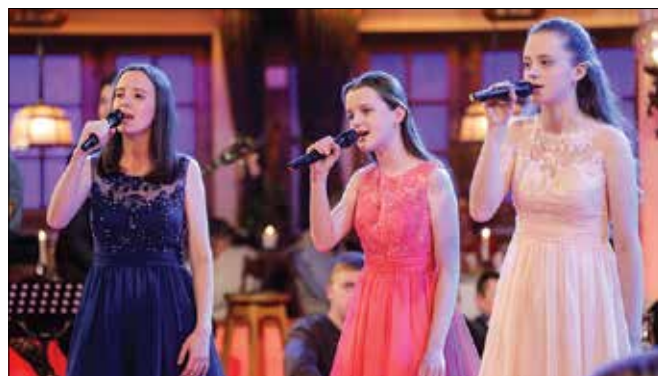
Sestre Čerček iz Solčave so nastopile v tekmovalnem delu oddaje Slovenski pozdrav in se uvrstile v naslednji krog.

Čerček iz Solčave. Pomerile so se kar s šestimi dekletki družine Ornik Kukovec iz Jurovskega dola ter napredovale v naslednji krog tek-