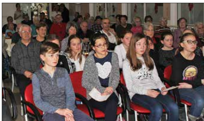
Stanovalci centra starejših so prisluhnili programu z gornjegrajskimi šolarji, ki so tudi nastopali.