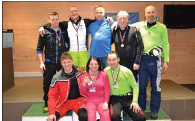
Ekipa IPA kluba Celje s pokalom za prvo mesto