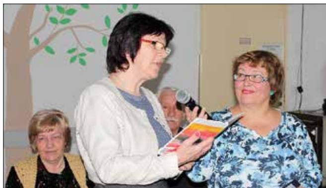
Svoja dela so predstavili člani KUD STOPinJE.

Poleg članov so v zbornik vključena dela mladih, ki so bili izbrani na natečaju Besedičica. Avtorji in avtorice v svojih delih opisujejo naravo, osebne občutke, prigradniške trenutke ter impresije iz spominov ali trenutnega življenja.