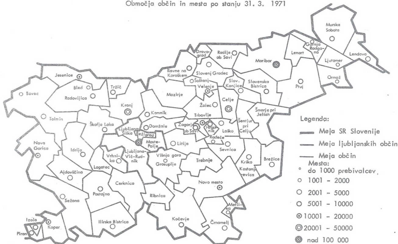
Območja občin in mesta po stanju 31. 3. 1971

Naslednji grafikon prikazuje teritorialno območje današnjih 60 občin po veljavnem predpisu o politično-teritorialni razdelitvi. Prikazana so tudi mesta po številu prebivalstva iz popisa 31. 3. 1971.