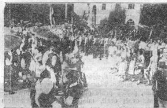
Zbirališče okrog Napoleonovega spomenika

benosti kmetsko mladinskega gibanja je bil izredno povdarjen v povorki, ki so jo tvorili fantje in dekleta, ki so predstavljali kosce, grabljice, tesače, mlatiče in s številnim drugim kmetskim orodjem, s katerim pridolujejo kruh za sebe in