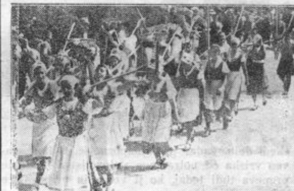
Naša dekleta navdušeno pozdravljajo na levo in desno.

za druge... Brhka dekleta so nosila krasen venec iz rumenega klasja, z napisom »Daj nam danes naš vsakdanji kruh...«. Sledile so članice naših društev (627!) z grabljami, srpi, motikami itd., ki so z veselo pesmijo na ustnih in rdečimi naglji na prsih dajale ogromni povorki izraz tovarištva in volje sodelovanja s fanti — tovariši za prosvetno povzdigo naše vasi. Mogočna arma-