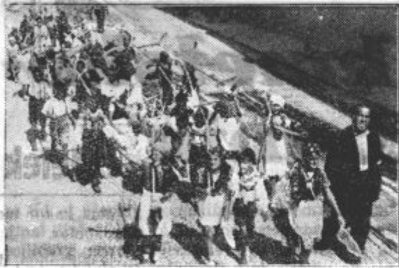
Vesela mladina v povorki s svojim rediteljem.

Drugi del te živopisne povorke je tvorilo 68 voz, ki so jih doma kmetski fantje priredili