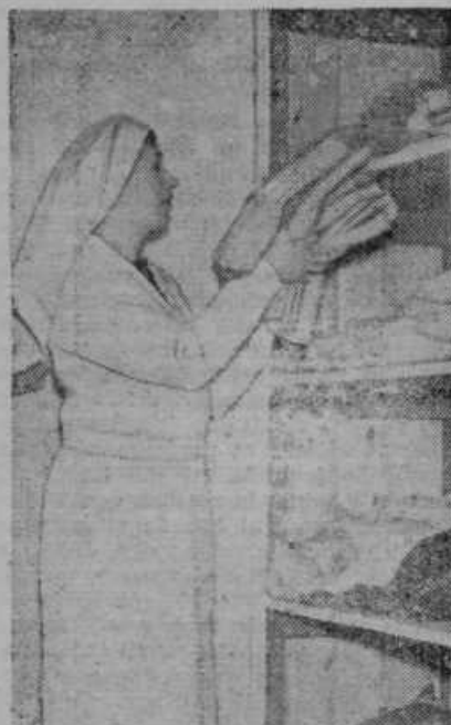
Angleška princesa Marija kot sestra Rdečega križa v londonski bolnišnici

hob na sejem postavili, svoje bogate zaloge blaga pa pripeljali, potem bo sejem večji kakor kak perzijski bazar! Žajfe ni, luga tudi ne, ko ni bukovih drv, potem se pa perilo zapere in postane žuto, to bo pa pobožnim spet prav, ko žuto perilo in bele duše pasajo skup, to je cerkvena barva! Eno v drugo in gospodarstvo bo v redu!