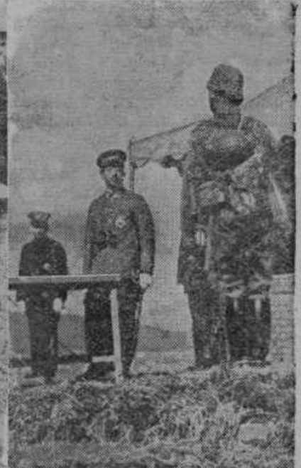
Japonski cesar Hirohito poslušal poročilo na manevrih

Luka, ta Luka se bo vrnil med poštene ljudi in bo postal pošten človek. A on, Mikica? On bo ostal zadnja reva na svetu, njemu, meščanskemu sinu, se bo godilo slabše kot temu pankrtu, temu beraču, temu hudobnežu, zaradi katerega je dvakrat skoval zločin. Ne, ne, ne, ne! Pisar je škripal, vsa kri je plamtela v njegovih žilah, kolena so mu klecala, ustne in roke so drhtele od jeze — ali pri vsem se je smehljaj, tako zadovoljno, tako veselo smehljaj, kakor da mu je padla v krilo največja sreča tega sveta. Počasi, zamišljeno je krenil v krčmo, da se okrepi z žganjem, a ko se je začelo mračiti, ko ga nihče ni videl, se je odplazil k mlademu odvetniku Andriču.