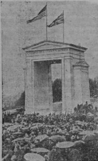
Spomenik miru na meji med Kanado in Združenimi državami