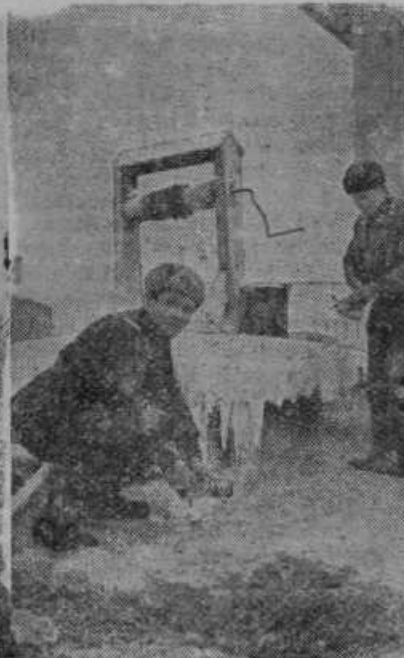
Finska vojaka čistita kuhinjsko posodo pri zamrznjenem vodnjaku