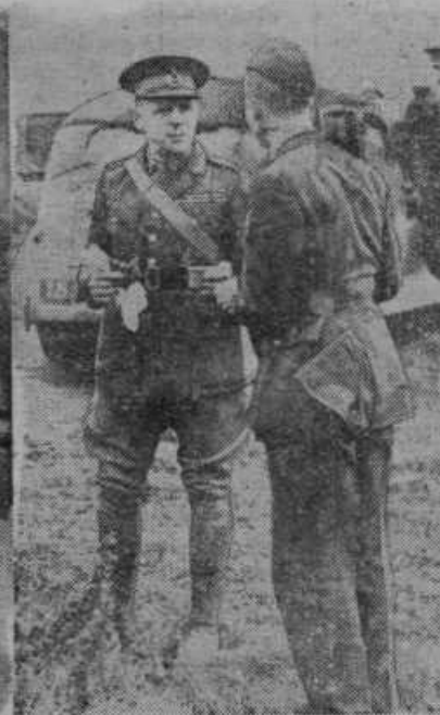
General Gort, poveljnik angleških čet na Francoskem, s častniki