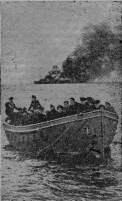
Podmornica je torpedirala parnik. Mornarji in potniki so se zatekli v rešilni čoln