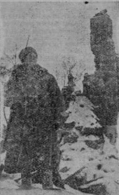
Finski vojak na straži pred svojim domom, katerega je porušila sovjetska letalska bomba