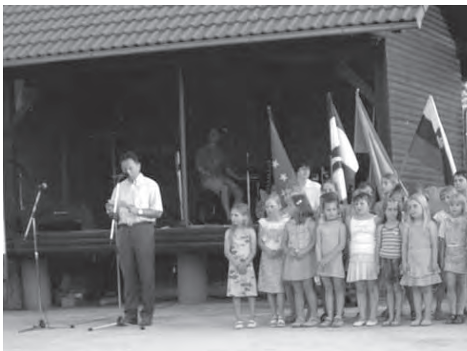
ŽUPANOV POZDRAV OB DNEVU DRŽAVNOSTI

Najdete nas na Taborski c. 3 v Grosuplju in po telefonu (01) 781-03-20 ali (01) 781-03-28