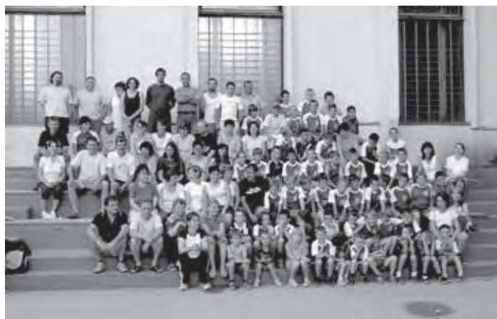
ZAKLJUČEK OTROŠKE NOGOMETNE ŠOLE