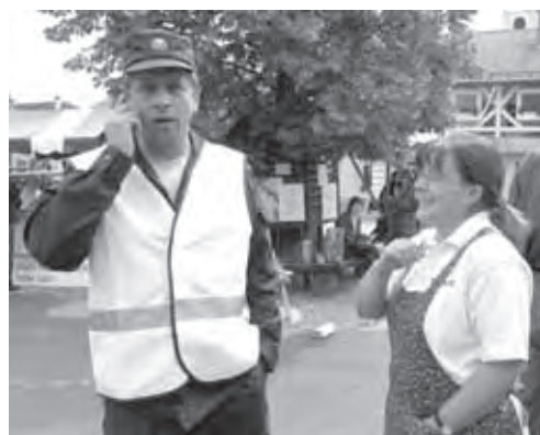
REDAR JE RESNO OPRAVLJAL SVOJE DELO

temi je bilo letos opaziti kar nekaj svežih obrazov. Zahvala velja vsem, ki so sodelovali ali obiskali dogajanje pred Levstikovim domom, o utripu s prizorišča pa naj spregovorijo fotografije.