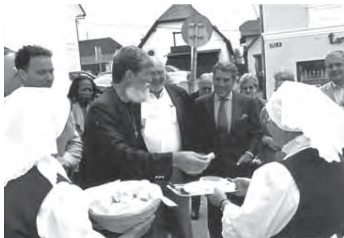
SPREJEM MONAŠKE DELEGACIJE PRED OBČINSKO STAVBO V VELIKIH LAŠČAH

vzgojiteljicami. Otroci so delegaciji zapeli nekaj pesmi. Po ogledu vrtca, nad katerim so bili izredno navdušeni, so odšli na kosilo v Gostilno pri Kuklju. Obisk naše občine so zaključili s sveto mašo, ki jo je na željo monaških gostov v francoskem jeziku daroval Peter Opeka v znameniti cerkvi na Veliki Slevici.