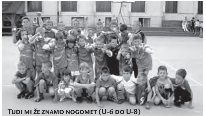
TUDI MI ŽE ZNAMO NOGOMET (U-6 DO U-8)

V vseh starostnih skupinah je na turnirju nastopilo kar 120 mladih nogometašev. Prireditev je organizacijsko in tekmovalno popolnoma uspela. Poleg pokalov so najboljše ekipe prejele tudi praktične nagrade, najboljši posamezniki pa medalje. Za ekipe je bilo dobro poskrbljeno, saj smo omogočili uporabo slačilnic v šolski telovadnici ter pripravili sladek prigrizek in osvežitev s pijačo za vse udeležence. Malo manj vzpodbudno je bilo le manjše število gledalcev ob tekmah starejše skupine.