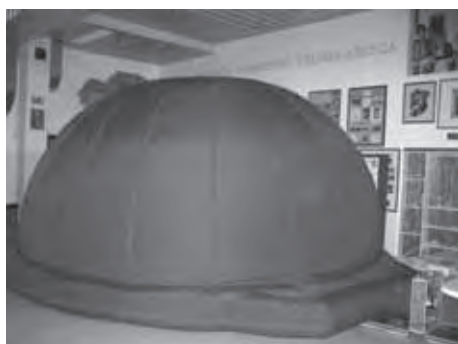
V AVLI SO POSTAVILI VELIK ŠOTOR – PLANETARIJ

Učenci so natančno opazovali, eksperimentirali, analizirali, sklepali in končno zapisali dobljene rezultate, ki so jih ugotovili. Osvajali so ustrezne statistične metode dela. Ogledali so si Križno jamo in jo raziskovali, obiskali Hišo eksperimentov in razstavo mineralov v Ljubljani, si ogledali planetarij in doživeli astronomsko jutro. Porodila se jim je množica ustvarjalnih idej. Doma so delali različne poskuse iz fizike in v lastni režiji samostojno posneli štiri zgoščenke s poskusi.