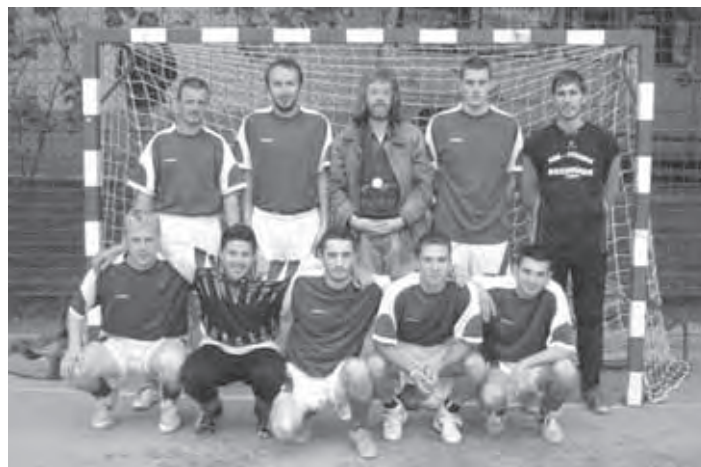
REPREZENTANCA VELIKE LAŠČE - DRUGI