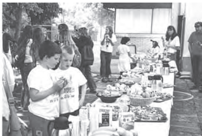
Najprej si je bilo potrebno malo »dušo privezati«