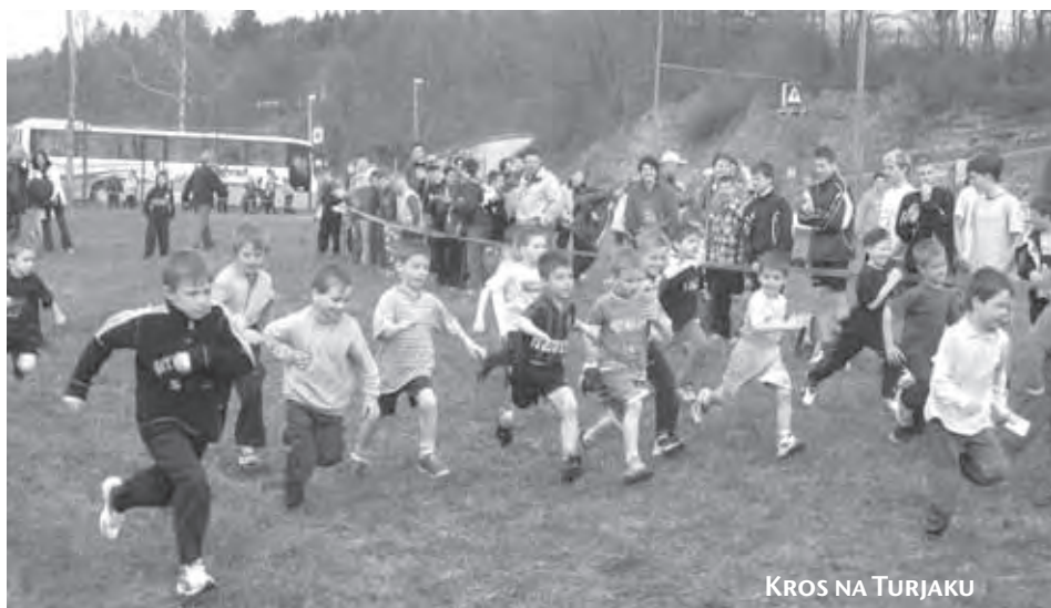
KROS NA TURJAKU