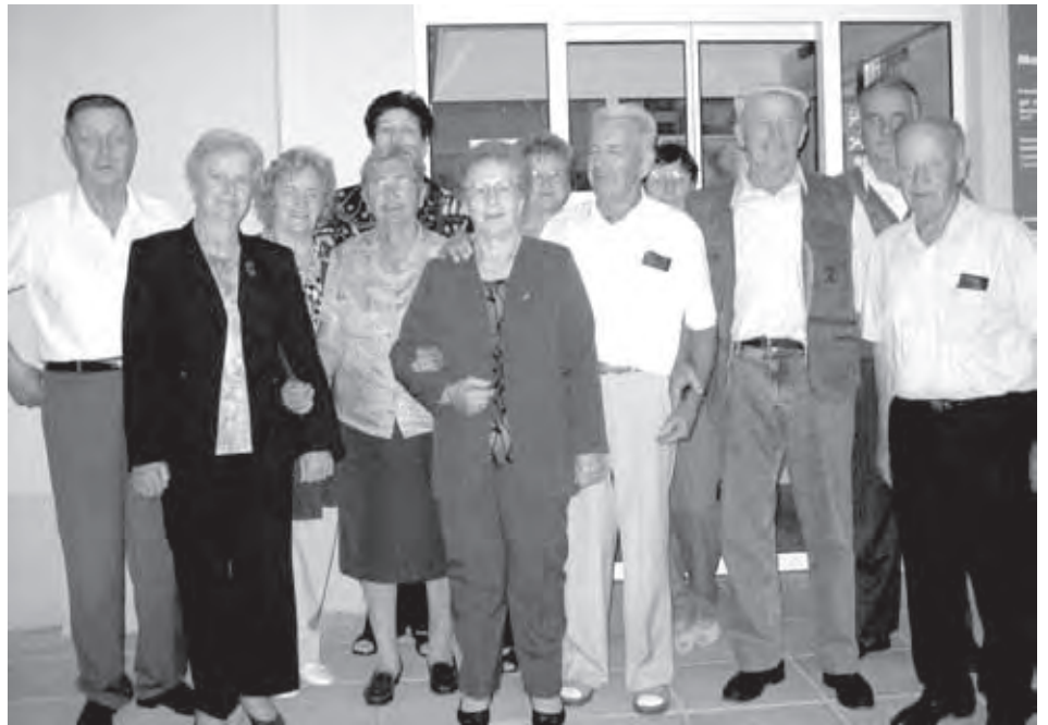
ŽELJA USTANOVITELJEV JE BILA, DA SE SLIKAJO PRED DOMOM KRAJANOV, SAJ SO TUDI SAMI UDARNIŠKO GRADILI DOM

kulturno društvo v Sloveniji, ki nosi skladateljevo ime. Vse bolj se zavedamo, da je takratna ideja prišla od domačina in je edina v Sloveniji. Prav to nam daje moč za nadaljnje kulturno delo, pri tem pa moramo biti ponosni in samozavestni.