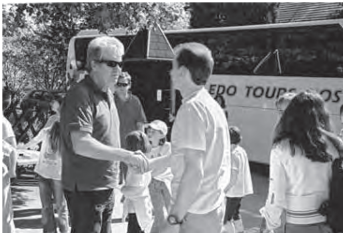
Prihod gostov: ravnateljev, učiteljev, učencev in njihovih staršev

Srečanja, ki je potekalo v Velikih Laščah in oklici 26. maja 2006, se je udeležilo pet pobratenih šol: OŠ Primoža Trubarja Bazovica pri Trstu, OŠ Primoža Trubarja Laško, OŠ »Nikola Tesla« Rijeka, OŠ Preserje in gostiteljica OŠ Primoža Trubarja Velike Lašče. Dopoldne je bilo posvečeno prikazu strokovnega dela z nadarjenimi učenci, popoldne pa prikazu furmanske dediščine naših krajev.