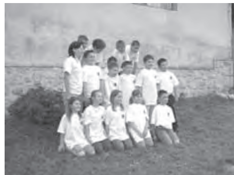
SKUPINSKA SLIKA - ZDAJ SMO VSI ENAKI