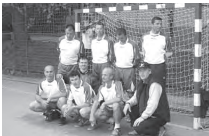
NK VELIKE LAŠČE – TRETJI