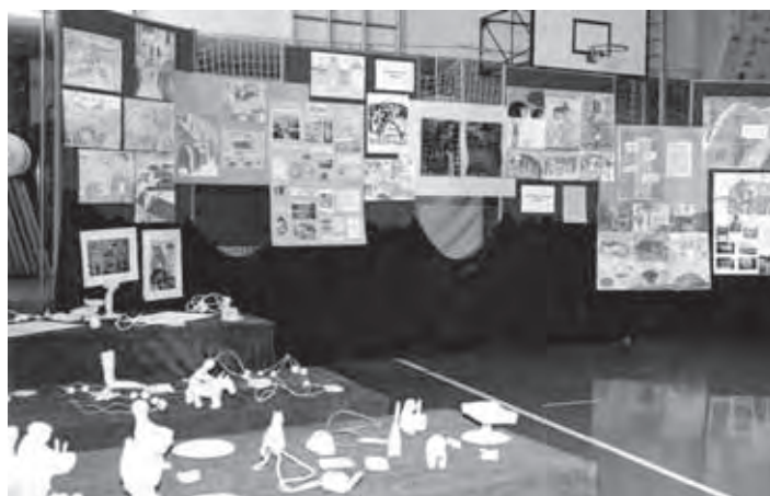
Zanimiva je bila tudi likovna razstava del nadarjenih učencev s sodelujočih šol v šolski telovadnici