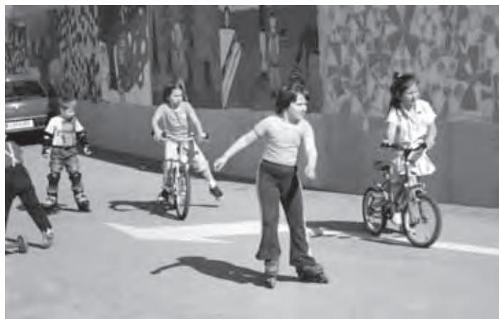
KOLESARJENJE IN ROLANJE PRED VRTCEM

Palček bralček in Bralni nahrbtnik (48 otrok), sodelovali na Najdihojci v Levstikovem domu, izvajali dejavnosti za športni program Zlati sonček, veliko je bilo izletov v bližnjo okolico, redno so obiskovali šolsko knjižnico in Knjižnico Prežihov Voranc, najstarejši so bili na krajših počitnicah v Zapotoku. Otroci so se lahko vključili v plesne urice in tečaj angleškega jezika. Nekatere dejavnosti so starši financirali v celoti, za nekatere (plavanje, del smučanja, del abonmaja, nekaj prevozov) pa je sredstva prispevala Občina Velike Lašče, za kar se jim iskreno zahvaljujem.