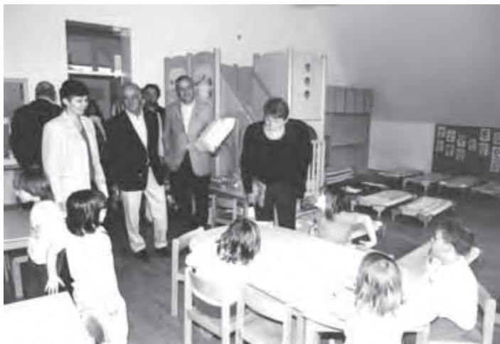
GOSTJE SO OBISKALI TUDI VRTEC SONČNI ŽAREK