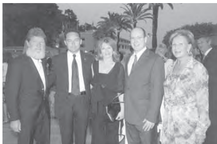
ŽUPAN Z MONAŠKIM KNEZOM