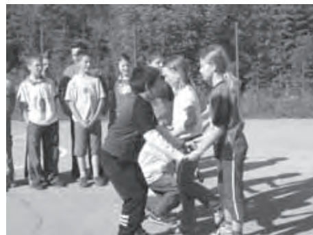
PLES OB BISTREM POTOČKU

»NA SVETU SI, DA GLEDAŠ SONCE. NA SVETU SI, DA GREŠ ZA SONCEM. NA SVETU SI, DA SAM SI SONCE IN DA S SVETA ODGANJAŠ SENCE.«