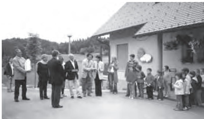
OBISKALA STA NAS G. PEDRO OPEKA IN DELEGACIJA IZ MONAKA

Poleg rednega programa smo izvajali tudi dodatni program in obogatitvene dejavnosti. Brez teh vsebin bi bilo življenje v vrtcu manj raznoliko in zanimivo. Otroci so se udeležili smučarskega tečaja na Trešnici (18 otrok), plavalnega tečaja v Ljubljani (35 otrok), spremljali so predstave gledališkega abonmaja (vse skupine), izvajali predšolsko bralno značko –