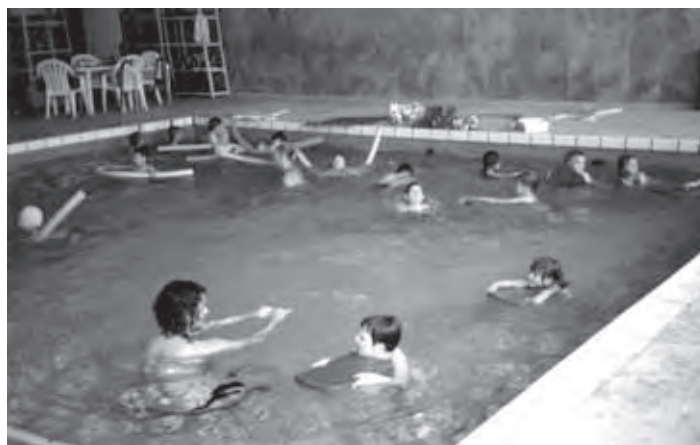
PLAVALNI TEČAJ NA OŠ SAVSKO NASELJE

V letošnjem letu odhaja iz vrtca 35 otrok, ki bodo septembra že šolarji.