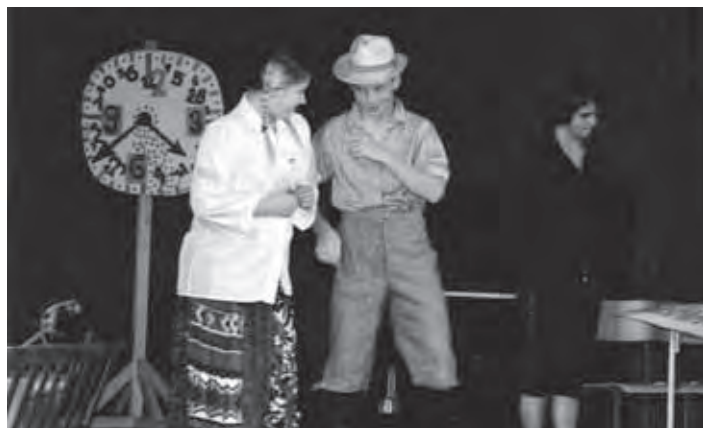
Med drugimi predstavitvami dela nadarjenih učencev so naši mladi igralci postavili na oder tudi furmanske čase