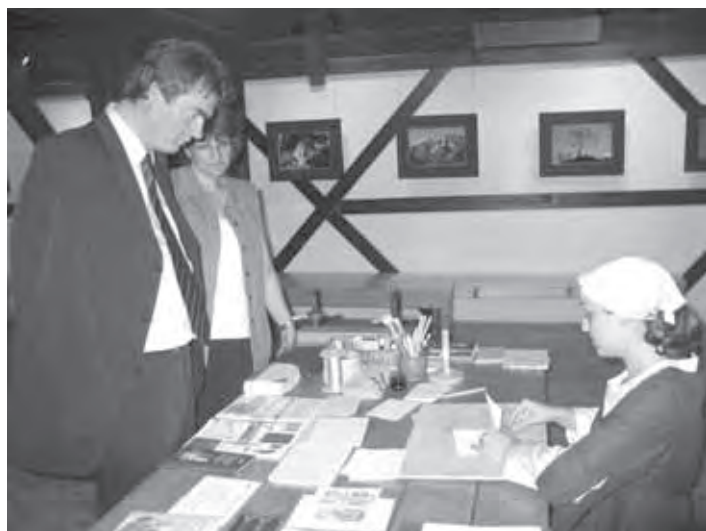
MINISTER ZVER OB OGLEDU PROGRAMA ROČNE VEZAVE KNJIGE