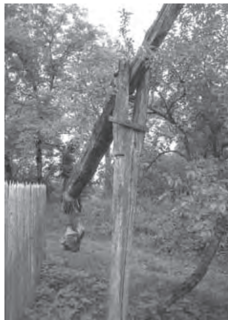
TAKO SO DVIGALI VODO IZ VODNJAKOV