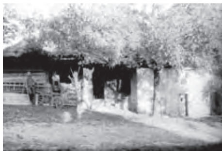
BAJDETOVA KAJŽA, KI JE NI VEČ