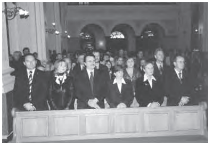
KONCERTA SO SE UDELEŽILI TUDI POMEMBNI GOSTJE IZ POLITIČNEGA ŽIVLJENJA