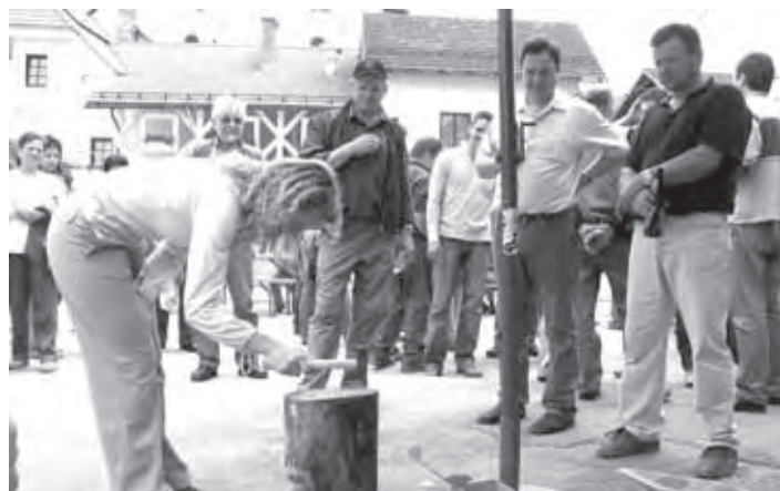
ZGLEDA ENOSTAVNO, PA NI TAKO