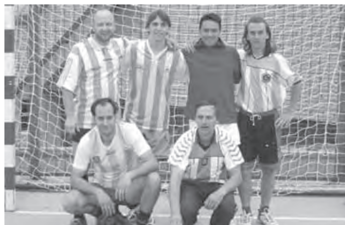
SLOVENIJA V SVETU - ČETRTI