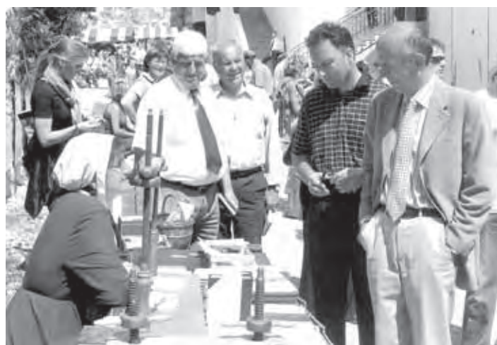
DR. JANEZ DRNOVŠEK JE OB PRVEM OBČNEM ZBORU GIBANJA ZA PRAVIČNOST IN RAZVOJ NA TURJAKU OBISKAL TUDI STOJNICO ZAVODA PARNAS.

Konec maja je bilo srečanje članov Gibanja za pravičnost in razvoj, katerega ustanovitelj je predsednik Drnovšek. Srečanja se je udeležilo preko tisoč ljudi, dogodek pa so spremljali tudi mikrofoni in kamere medijev. Popoldne pa je predsednik Drnovšek obiskal še Trubarjevo domačijo in prireditvi Dan sonca dodal poseben pomen. To je bila hkrati lepa priložnost, da delo sodelujočih društev iz naše občine postane znano širši javnosti.