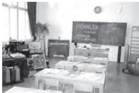
ŠOLSKI MUZEJ NA KARLOVICI

Učenci so letos obiskali Šolski muzej v Ljubljani in se udeležili delavnice Šola v času naših dedkov in babic. Zelo so bili presenečeni, ko jih je pozdravila zelo stroga gospodična učiteljica Kunigunda. Preizkusili so se v lepomislu. Prav tako so obiskali šolski muzej na Karlovcih. V juniju so obiskali še mesto Idrija in si ogledali tamkajšnje znamenitosti.