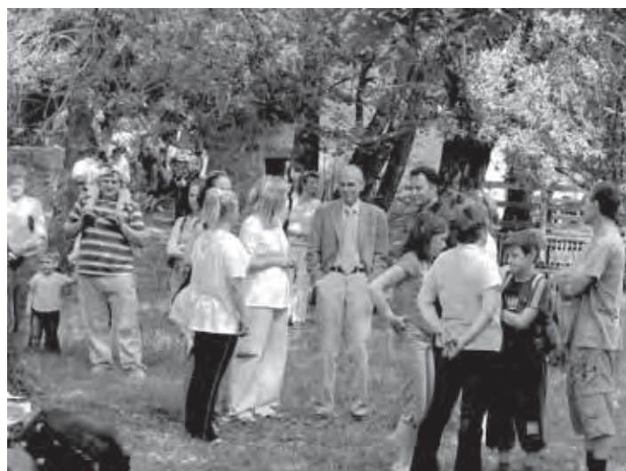
PREDSEDNIK SE JE ODZVAL VABILU ZAVODA ZA RAZVIJANJE USTVARJALNOSTI NA DAN SONCA

28. junija so mediji zopet poročali o predsedniku Drnovšku, ki je na Trubarjevi domačiji gostil hrvaškega predsednika Mesiča.