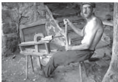
BAJDE IZDELUJE OSOVNIK