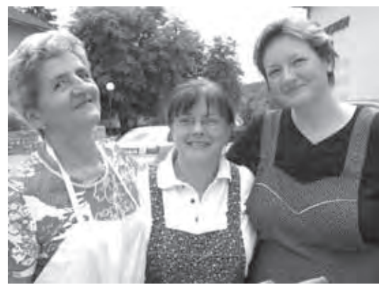
NAJBOLJŠE V ZABIJANJU ŽEBLJEV