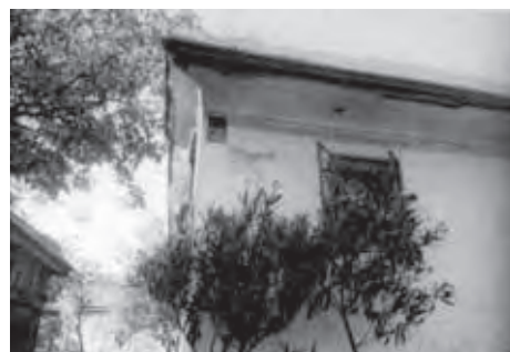
NEKOČ JE BILA NA GRADEŽU TUDI GOSTILNA, KAR DOKAZUJE ZNAK NA HIŠI, KI ŠE STOJI