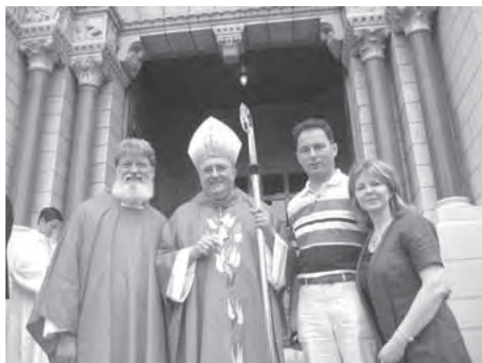
ŽUPAN Z NADŠKOFOM