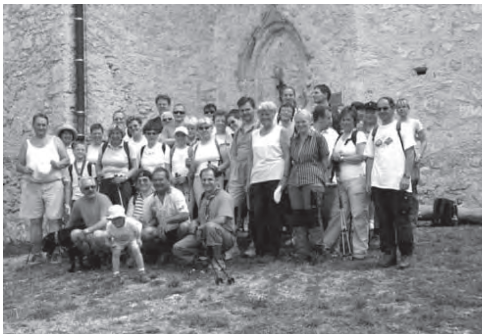
SKUPINSKA SLIKA PRED CERKVIJO SV. AHACIJA

Krnice smo se po strmih pobočjih spustili do zapuščenih Bajdiških mlinov. Nekoč pomembna mlina, ki sta dajala utrip in življenje okoliškemu krajem vse do 60. let prejšnjega stoletja, še nekako kljubujeta času, vendar je le vprašanje časa, kdaj se bodo debeli kamniti zidovi sesuli v brezoblični kup kamenja. In mimo žubori potok Bajdinščica, preskakuje z lepoto opevane slapove in s seboj odnaša grenkobo, ki jo daje pogled na propadanje zapuščine naših prednikov.