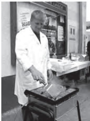
V LAŠČAH SE PEČEJO ČEVAPČIČI ... NAJBOLJŠI ZABIJALCI ŽEBLJEV