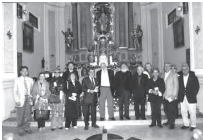
DELEGACIJA SI JE OGLEDALA VELIKOLAŠKO CERKEV