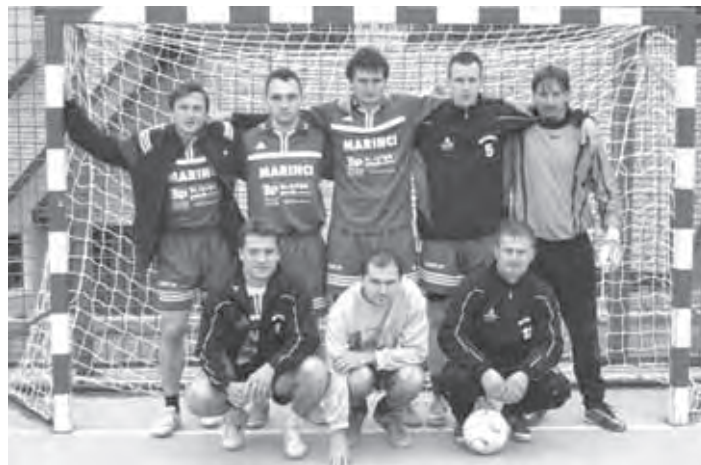
RAZKRIŽJE - PRVI