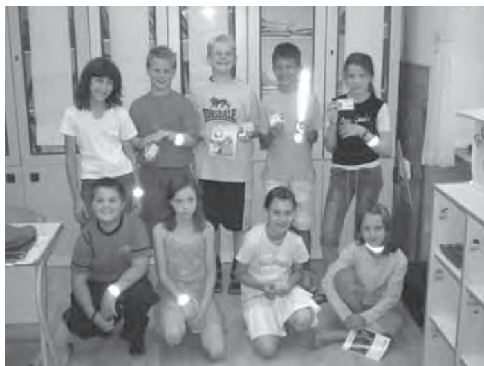
UČENCI 5. RAZREDA PŠ TURJAK S KOLESARSKIMI IZKAZNICAMI