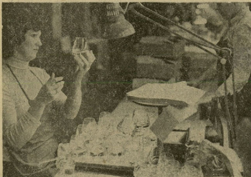
Vsem delovnim ženam v steklarni, v naši domovini in vsepovsod po svetu iskrene čestitke za 8. marec!