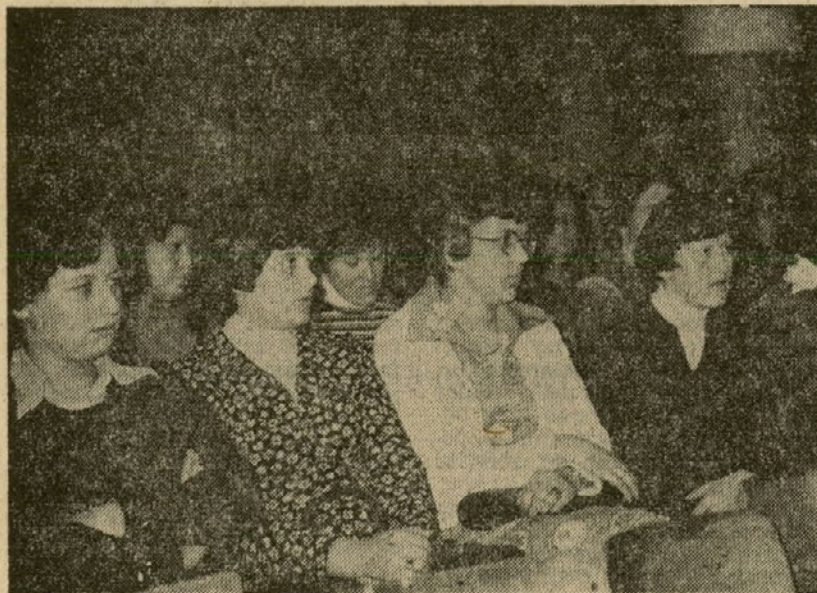
7 Med delavkami in delavci Steklarske šole prevladujejo mladi delavci. To se je pokazalo tudi po udeležbi na minuli letni skupščini osnovne organizacije sindikata — foto Lah.

Velja ocena, da je bila udeležba delegatov šole v občini in regiji pozitivna izjema v primerjavi z udeležbo drugih delegatov. Treba je poglobiti stike med delavci in delegati, kajti v nasprotnem primeru bo mogoče govoriti o uspešnem delovanju delegatskega sistema. Zaradi odhoda dveh članov delegacij je ostalo le 8 delegatov, medtem pa je število samoupravnih interesnih skupnosti večje.