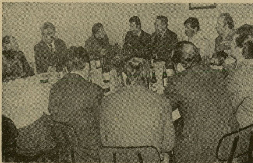
Na skupnem pogovoru z gosti iz skupščine SR Slovenije je beseda stekla o vsem, kar najbolj zanima delavce TOZD Slovenska Bistrica — foto Horvat.

Z zveznim zakonom št. 14 od aprila 1965 pa so prenehale veljati odredbe o strokovnem usposabljanju in o nazivih delavcev kakor tudi navodilo o izpiti delavcev na praktičnem delu v gospodarskih organizacijah za pridobitev strokovne stopnje. Od tedaj steklarna ni več organizirala omenjenih izpitov. Tako je sedaj mogoče strokovno izobrazbo pridobiti samo z izobraževanjem v poklicnih šolah in delovodskih šolah. Steklarska šola se trenutno ukvarja z mislijo o organiziranju delovodske šole, vendar